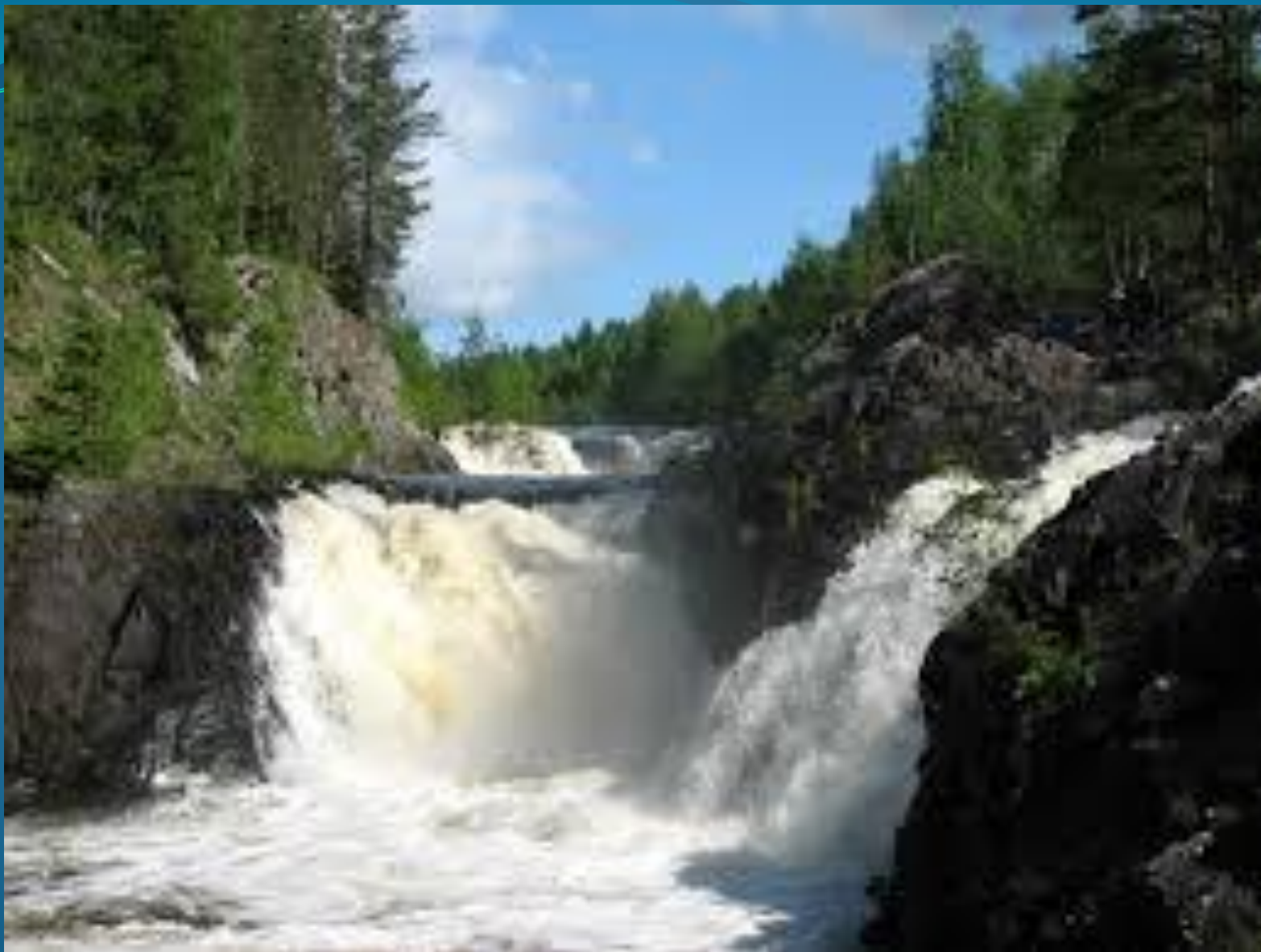
Самый большой и знаменитый водопад - Кивач