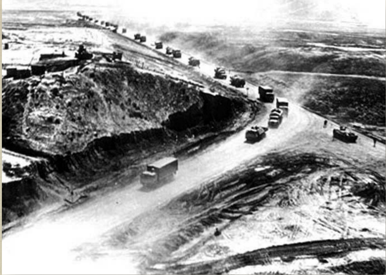
Магистраль Гарdez - Хост