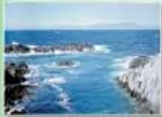
На берегу Тихого океана