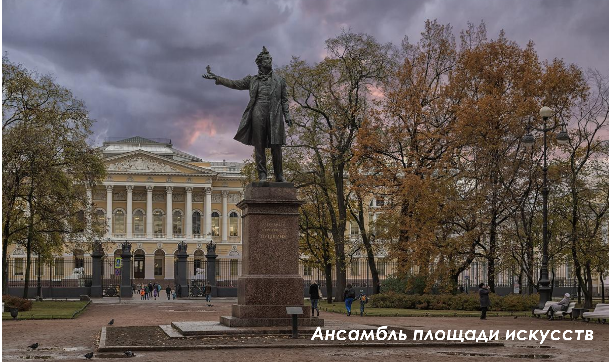
Ансамбль площади искусств