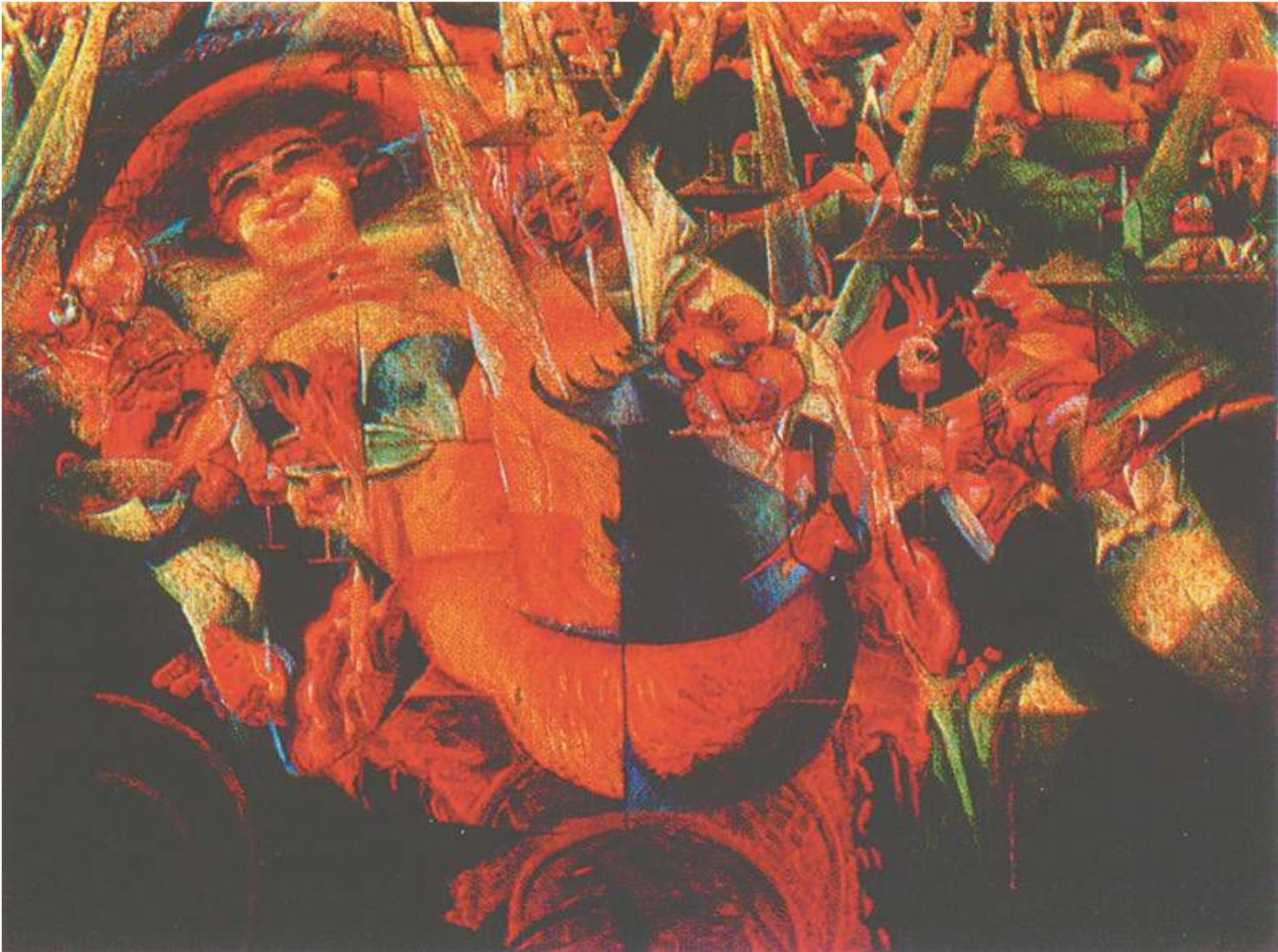
У. Боччони. «Смех», 1911 год