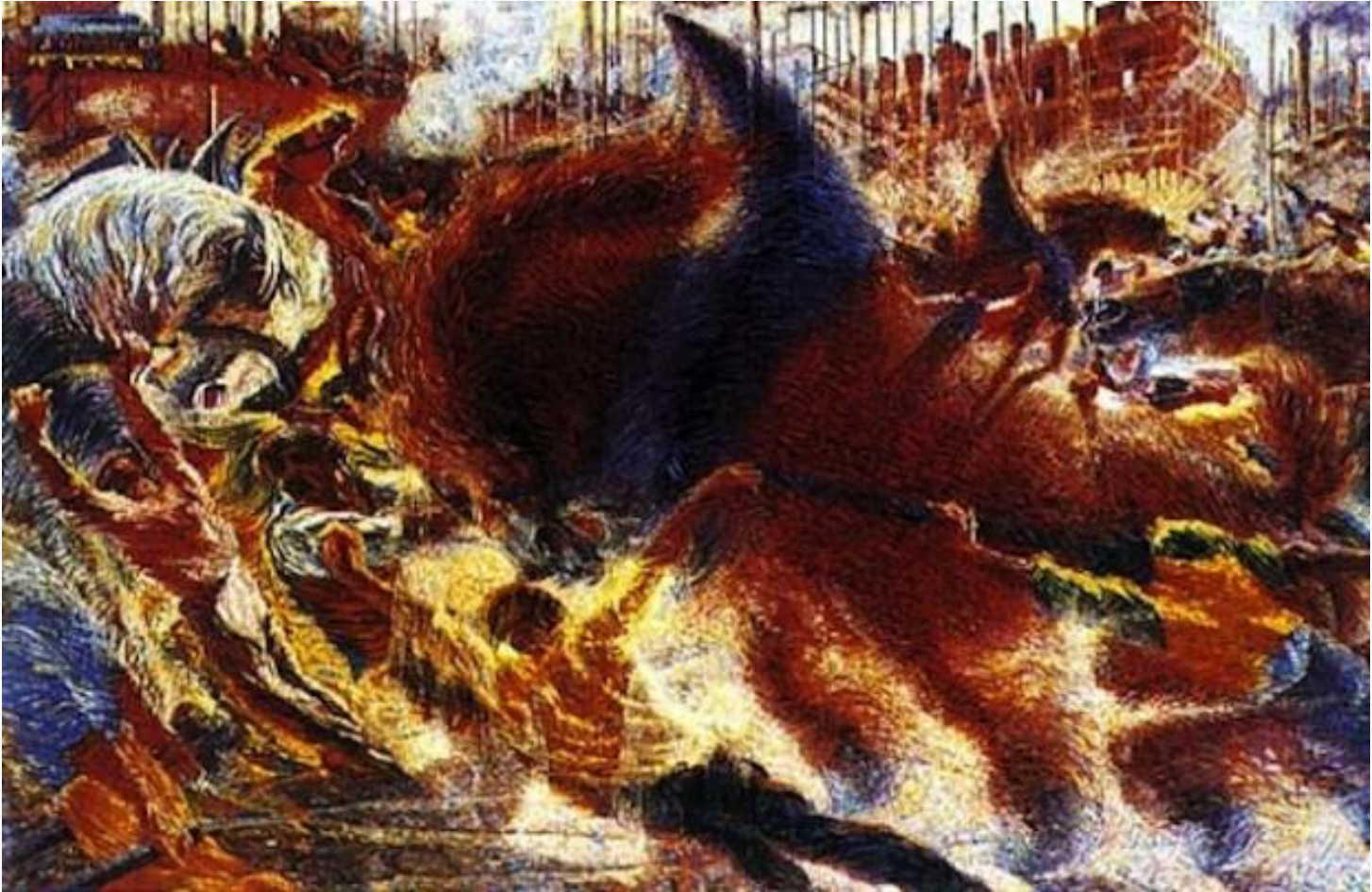
«Город восстает» (1910 г., Национальная галерея современного искусства, Рим)