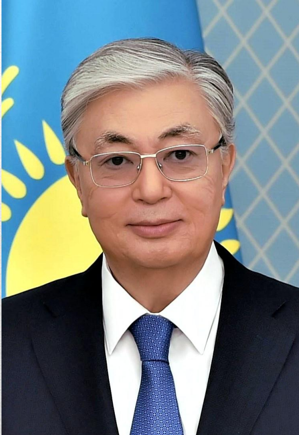
Касым-Жомарт Кемелевич Токаев