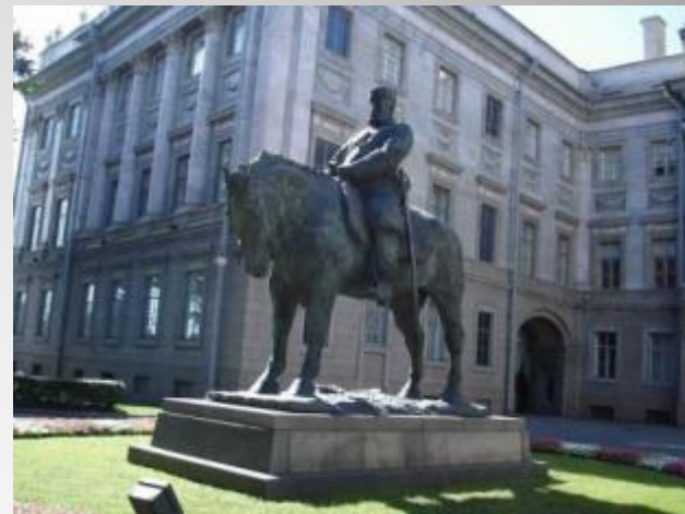
Москва. Памятник императору Александру III.