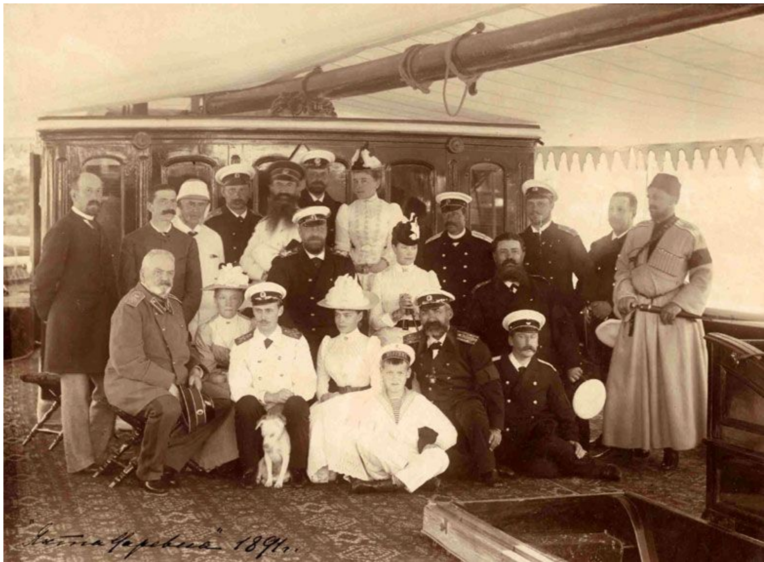
Летняя флотилия 1894г.