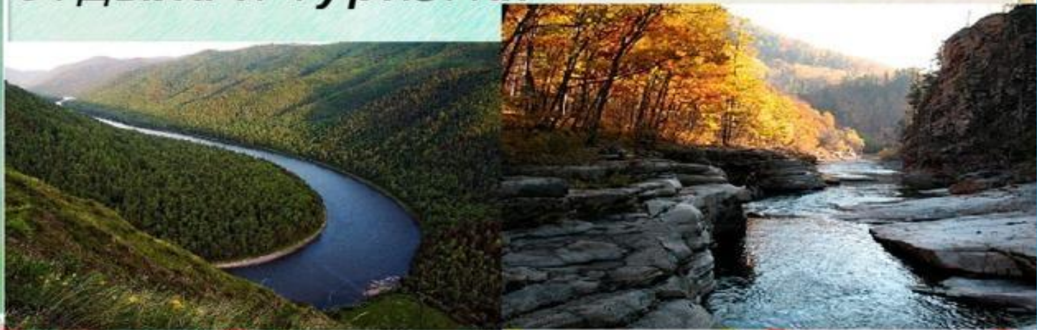
Тункинский национальный парк

Национальный парк - это территория, на которой охрана природы сочетается с использованием для массового отдыха и туризма.