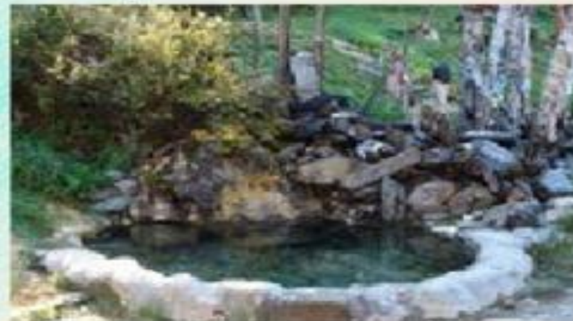
ГОРЯЧИЕ ИСТОЧНИКИ БАЙКАЛА