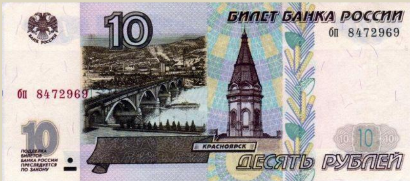
Аверс – лицевая сторона