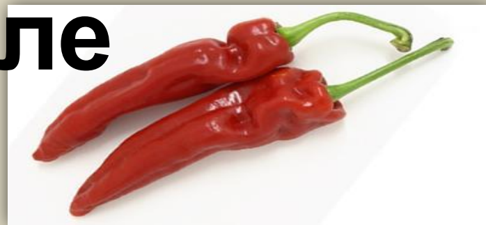
ПЕРУ И БОЛИВИЯ - ПЕРЕЦ