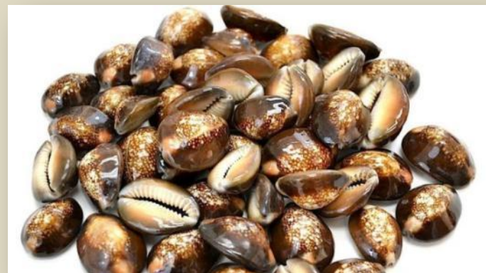
АФРИКА – РАКОВИНЫ КАУРИ