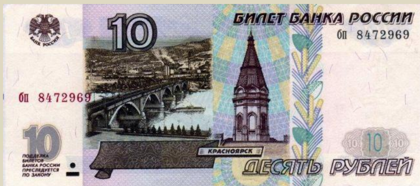
Аверс – лицевая сторона