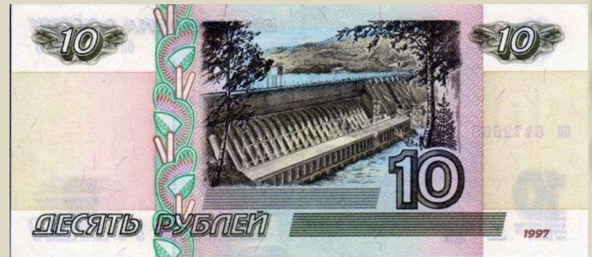
Реверс – обратная сторона