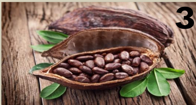
МЕКСИКА - КАКАО БОБЫ