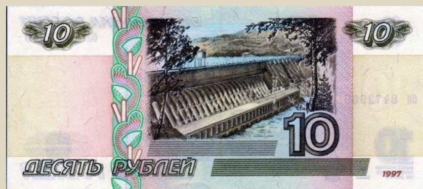
Реверс – обратная сторона