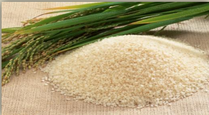
ФИЛИППИНСКИЕ ОСТРОВА - РИС