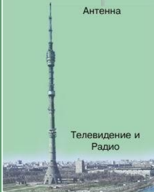
Телевидение и Радио

Подготовка сообщения о чрезвычайной ситуации