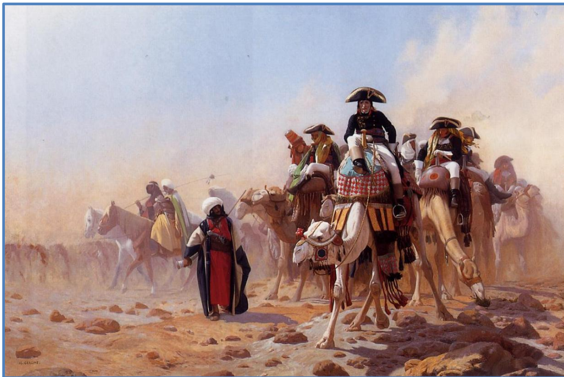
Жан-Леон Жером. Бонапарт в Египте