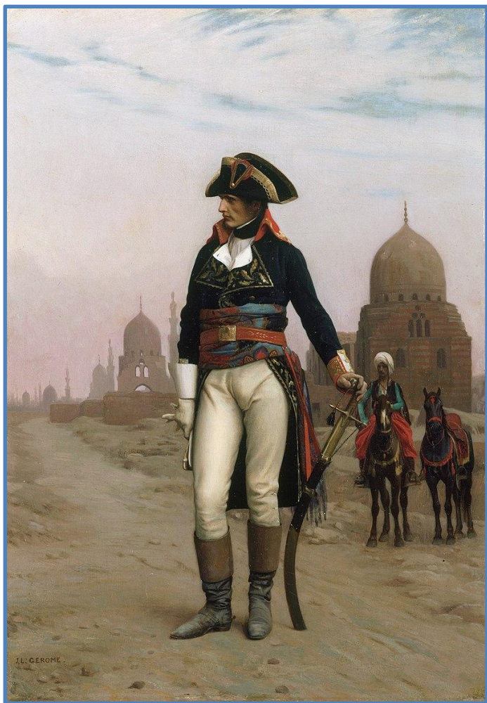
Генерал Бонапарт в

Наполеон выработал план экспедиции для занятия Египта, чтобы встать на сообщениях Англии с Индией, и без труда убедил Директорию в необходимости для Франции иметь колонию на Красном море, откуда кратчайшим путём можно достигнуть Индии. Правительство Директории, опасавшееся популярности Бонапарта, решило избавиться от его присутствия в Париже и отдало в его распоряжение Итальянскую армию и флот.