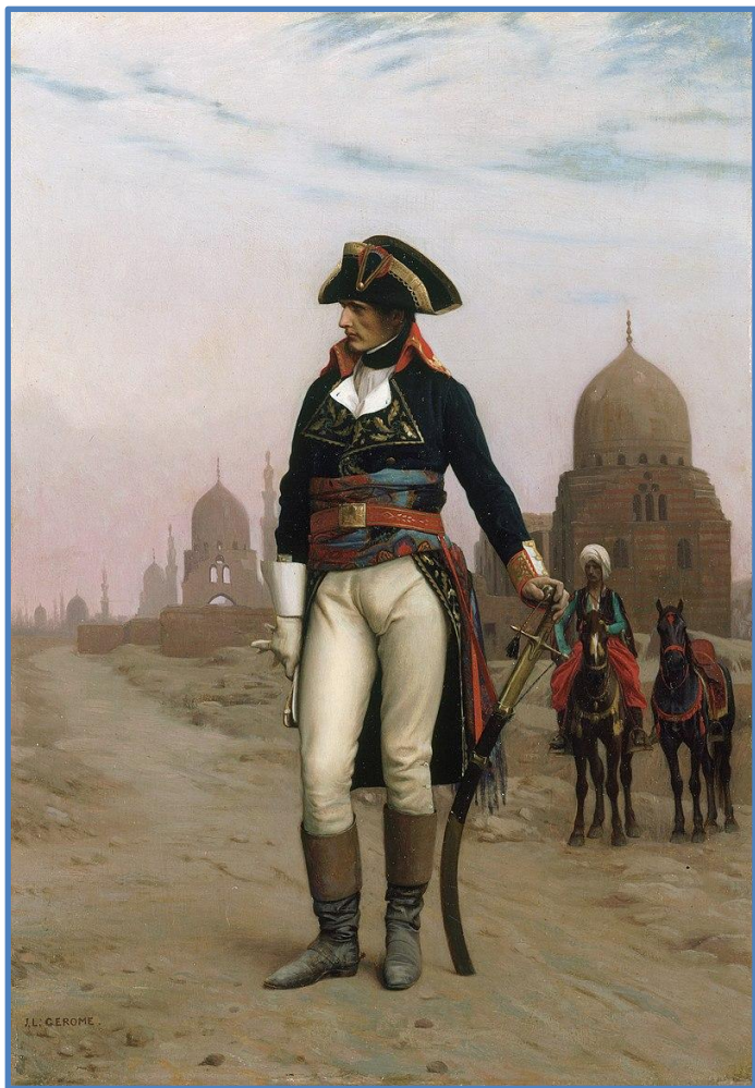
Генерал Бонапарт в

Наполеон выработал план экспедиции для занятия Египта, чтобы встать на сообщениях Англии с Индией, и без труда убедил Директорию в необходимости для Франции иметь колонию на Красном море, откуда кратчайшим путём можно достигнуть Индии. Правительство Директории, опасавшееся популярности Бонапарта, решило избавиться от его присутствия в Париже и отдало в его распоряжение Итальянскую армию и флот.