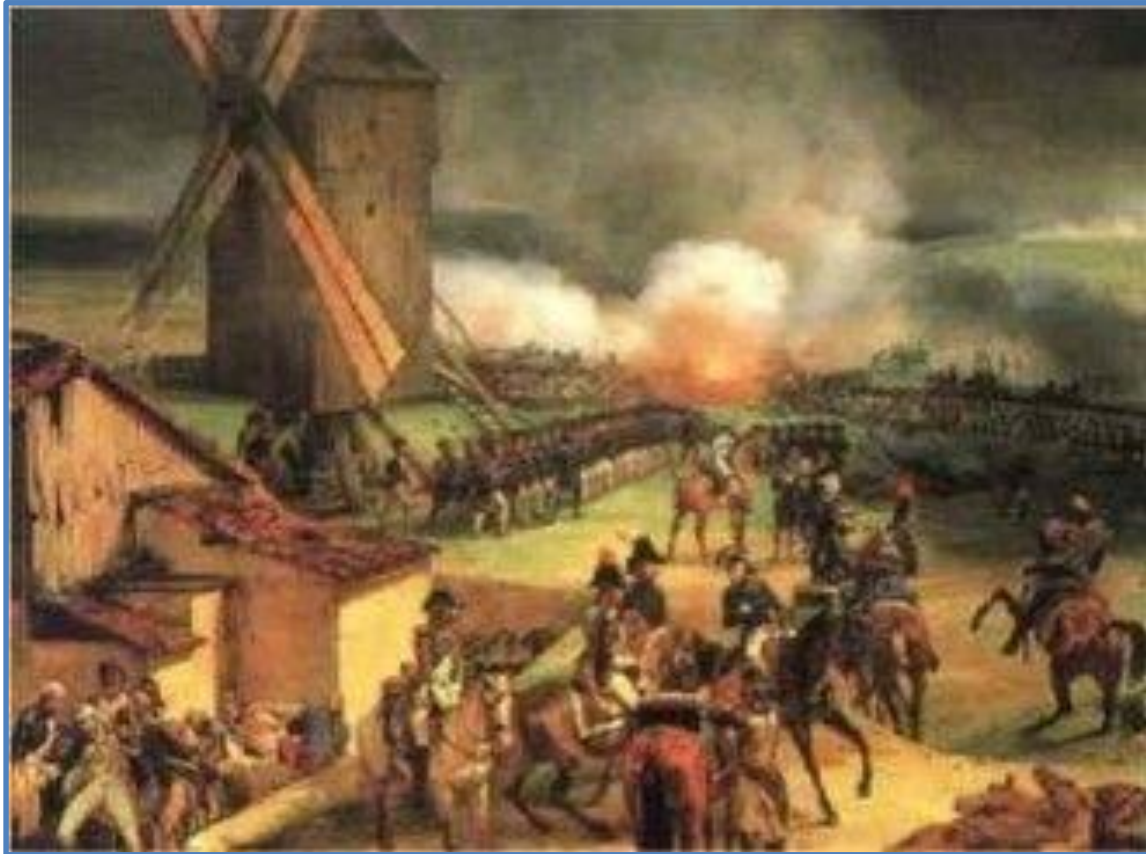
20 сентября 1792 г. – сражение у Вальми

Французы захватили Австрийские Нидерланды, часть территорий на Рейне и часть Швейцарии. 1793 г. – Франция заняла Рейнскую область. Г. Мейнц объявил о выходе из империи. Конвент принял Мейнц в состав Франции. Бельгия была присоединена к Франции.