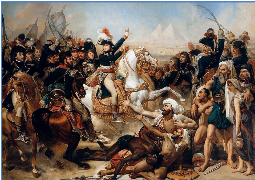
Антуан-Жан Гро. «Битва у пирамид»

Битва у пирамид произошедшее 21 июля 1798 года между французской армией численностью 20 000 солдат и турецко-египетской армией численностью около 60 000 человек (в битве участвовала 21 000). Сражение закончилось решительной победой Франции и разгромом турецко-египетской армии.