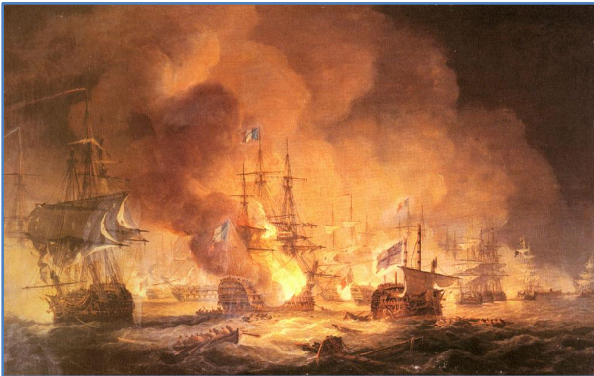
Томас Луни, «Битва у Нила 1 августа 1798 г. в 10 часов вечера»

Битва при Абукире — решающее морское сражение между флотом Великобритании под командованием адмирала Нельсона и флотом Французской республики под командованием адмирала де Брюе с 1 по 3 августа 1798 года. Результатом сражения стала решительная победа британцев.