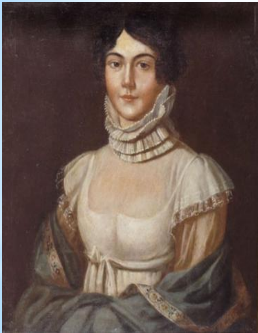
Мать Мария Михайловна Лермонтова, урожденная Арсеньева