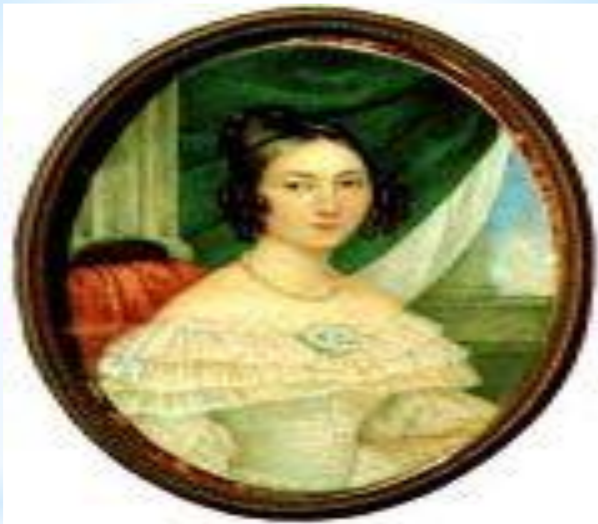
Первое юношеское увлечение Е.А.Сушковой