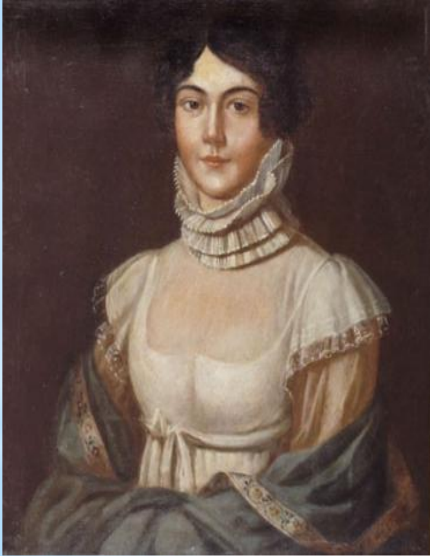
Мать Мария Михайловна Лермонтова, урожденная Арсеньева