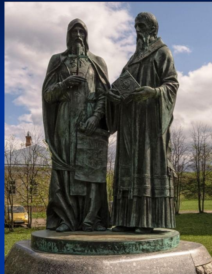
Памятник Кириллу и Мефодию. Дмитров. Россия