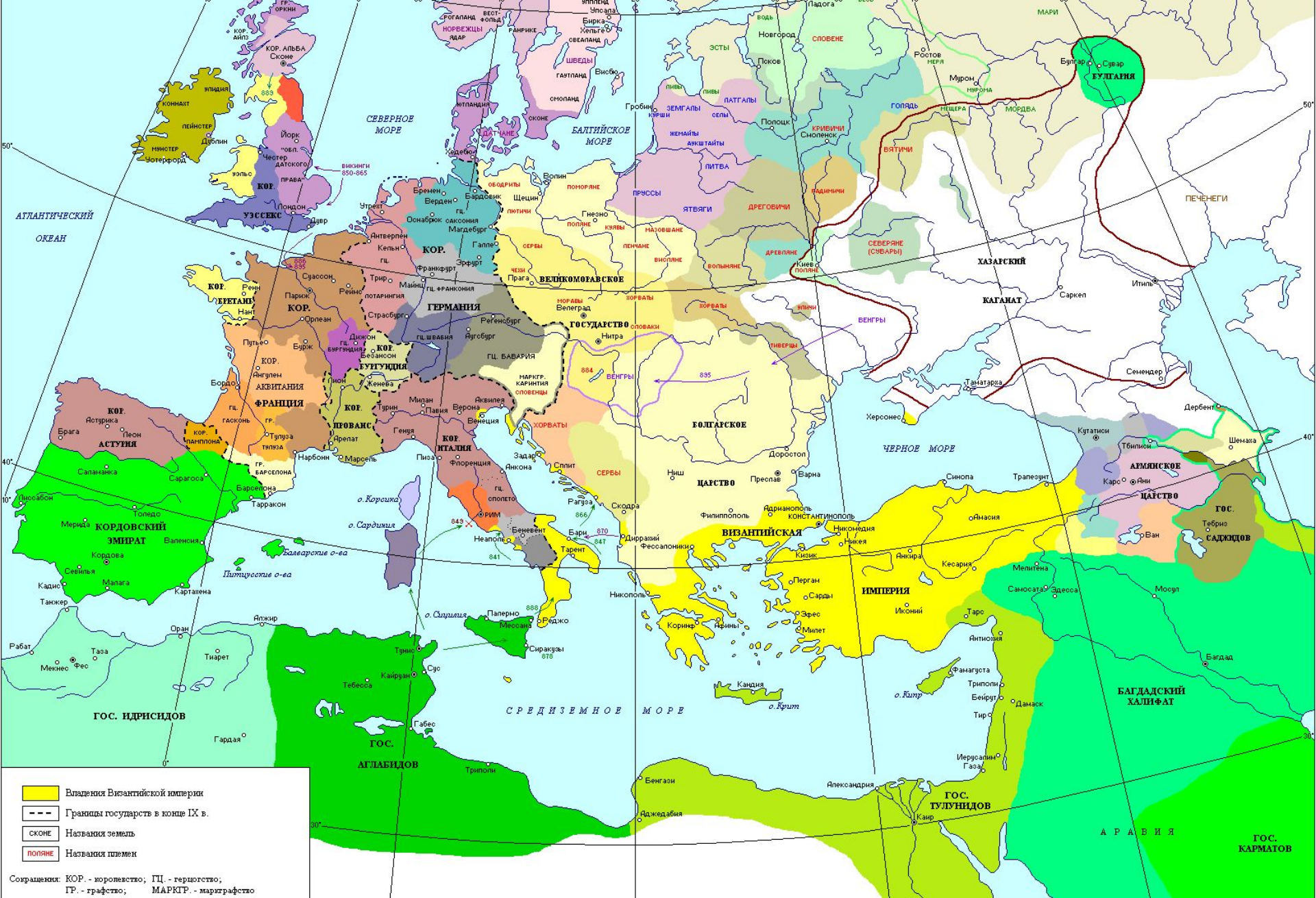
Европа в IX в. Карта