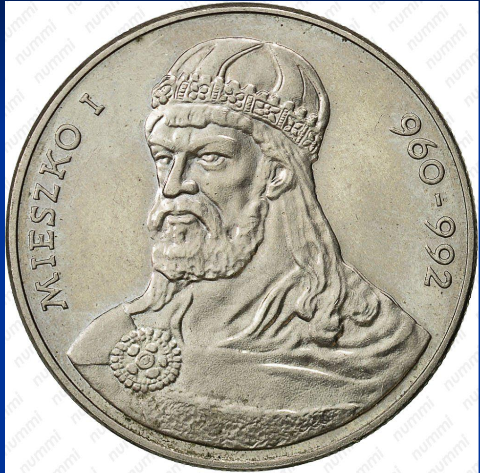
Мешко I. Монета. Польша