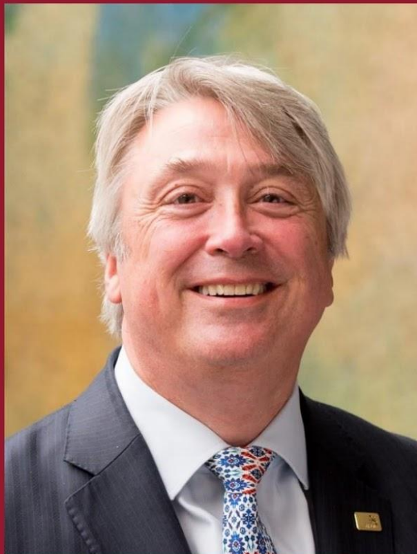
Саймон Бартли Президент (Великобритания)