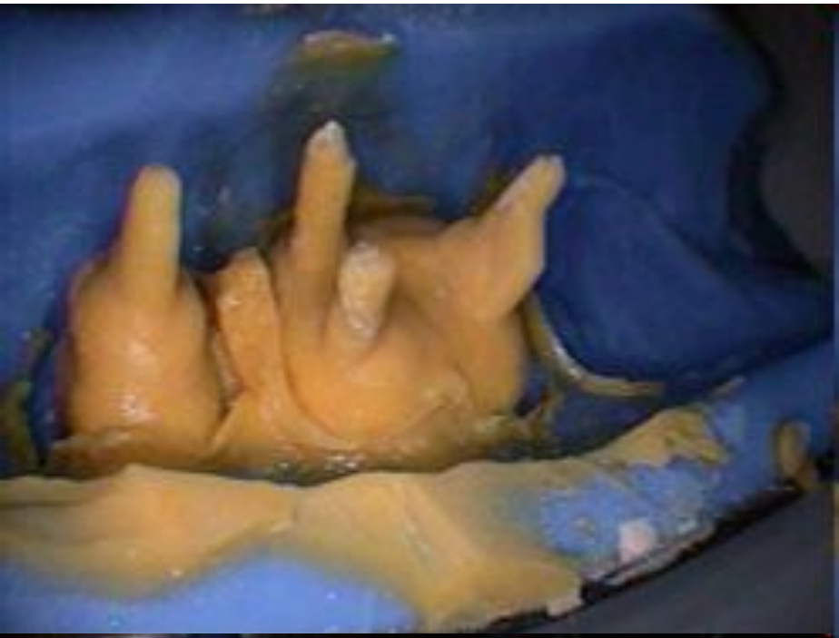
Культевая вкладка на зуб 46