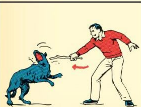
4. Когда собака нападает, используйте палку или камень в качестве оружия. Старайтесь целиться в глаза и бейте по горлу.