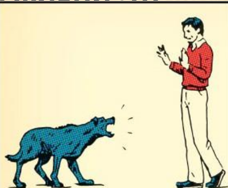
1. Стойте спокойно. Страх и агрессия разозлят собаку еще больше.