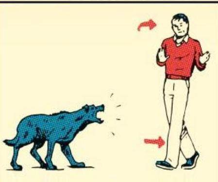
2. Не убегайте от собаки и избегайте зрительного контакта; медленно отойдите от животного.