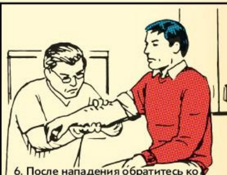
6. После нападения обратитесь ко врачу по поводу бешенства и других заболеваний, переносчиками которых являются собаки. Обратитесь в полицию и службу отлова бродячих животных.