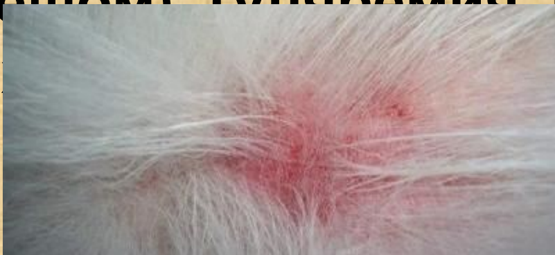
Лишай у собаки

Но есть и множество других заболеваний, передающихся с животными: лишай (грибковое заболевание), чесотка (вызывается чесоточным клещом), туляремия, лептоспироз, геморрагическая лихорадка. Очень длинный.