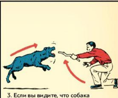
3. Если вы видите, что собака собирается напасть, поместите что-нибудь между вами — палку, пиджак, что-то, что защитит вас.