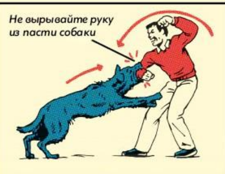
Не вырывайте руку из пасти собаки 5. Если укус неизбежен, подставьте предплечье, оставив 3 конечности свободными для того, чтобы напасть на собаку и защитить лицо и живот.