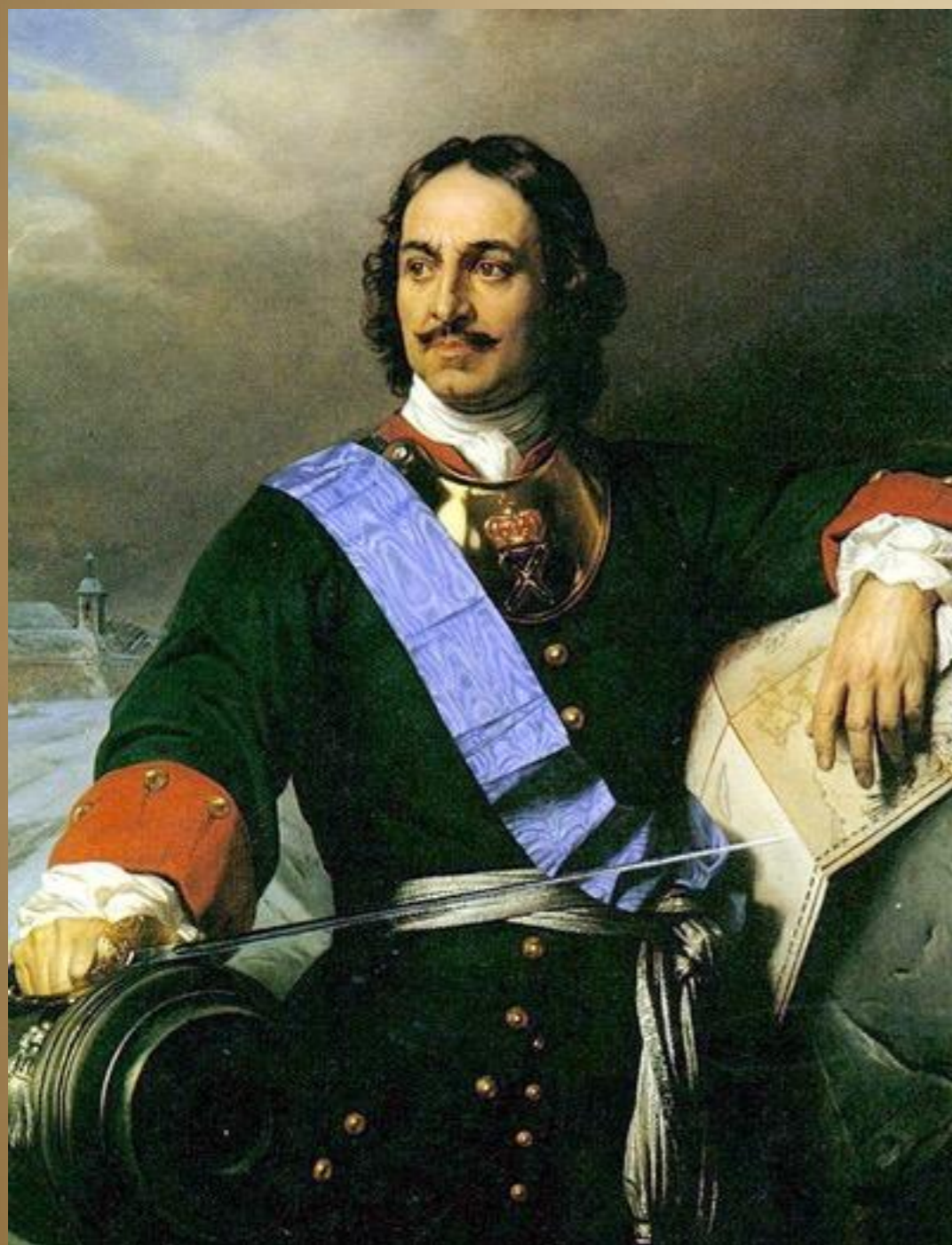
Петр I (1672-1725)

На этой конференции я хотел бы представить вашему вниманию свой мультимедийный проект, посвященный личности Петра 1-го .