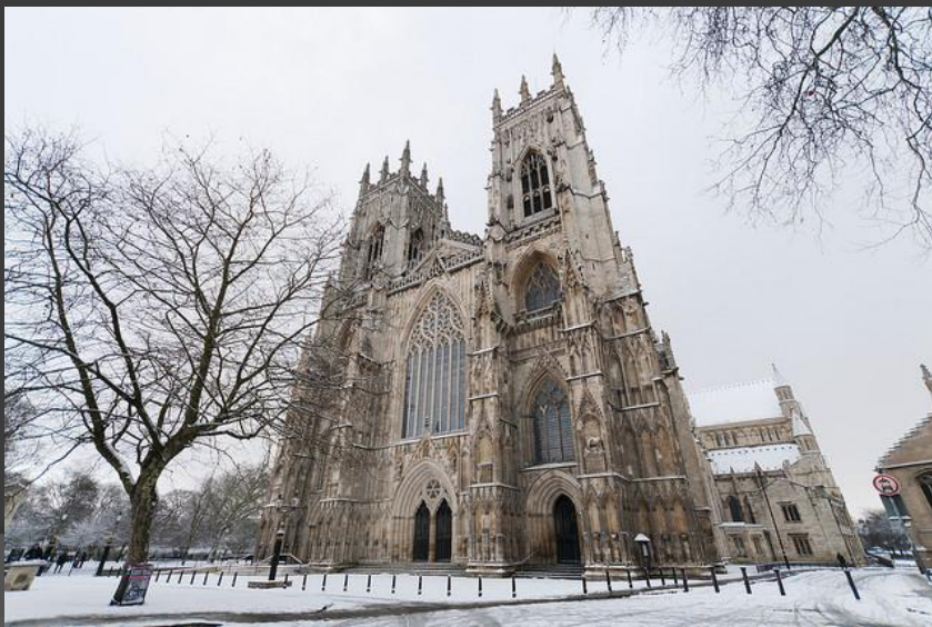
Йоркский собор (Англия, 13 в.)