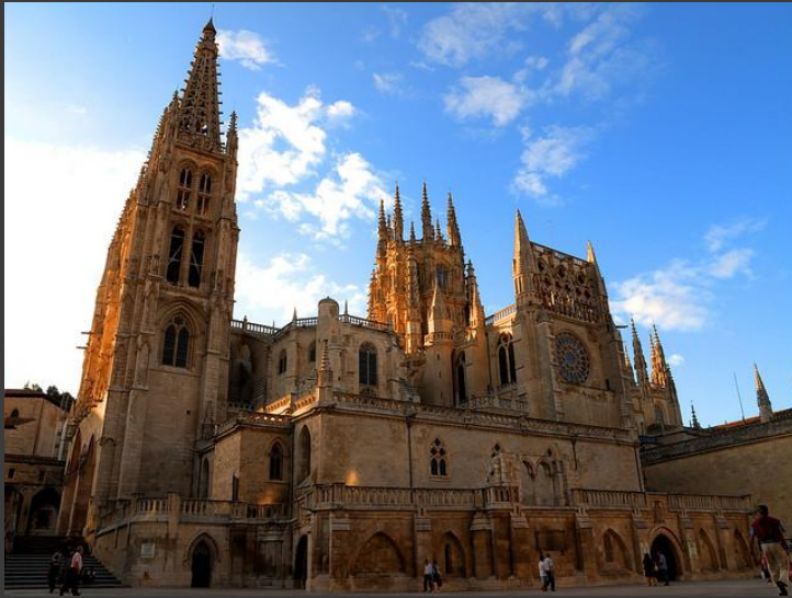
Бургосский собор (Испания, 13 в.)