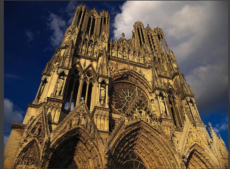
Реймский собор (Франция, 13 в.)