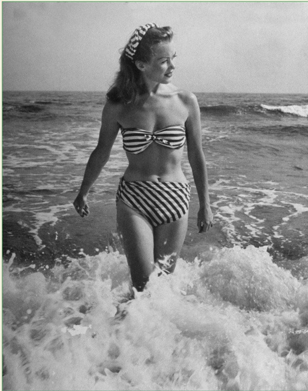
«Французская актриса Барбара Лаж», 1946