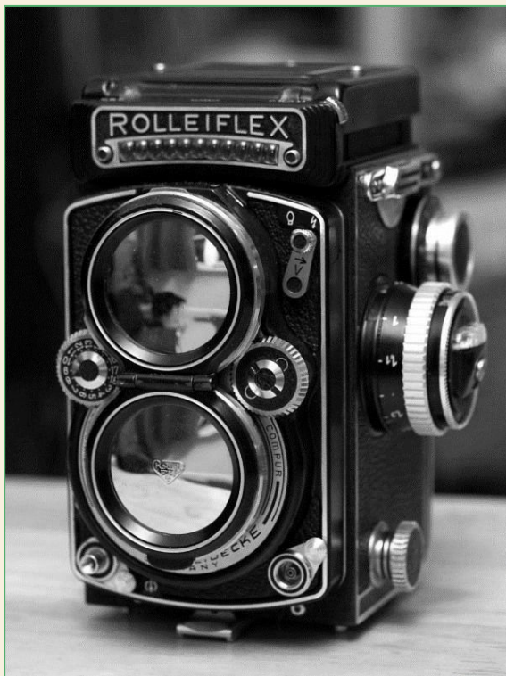
Двухобъективный зеркальный фотоаппарат Rolleiflex