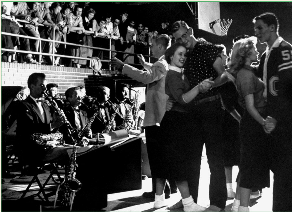
«Студенты танцуют в Карлсбаде, штат Калифорния, средняя школа», 1954