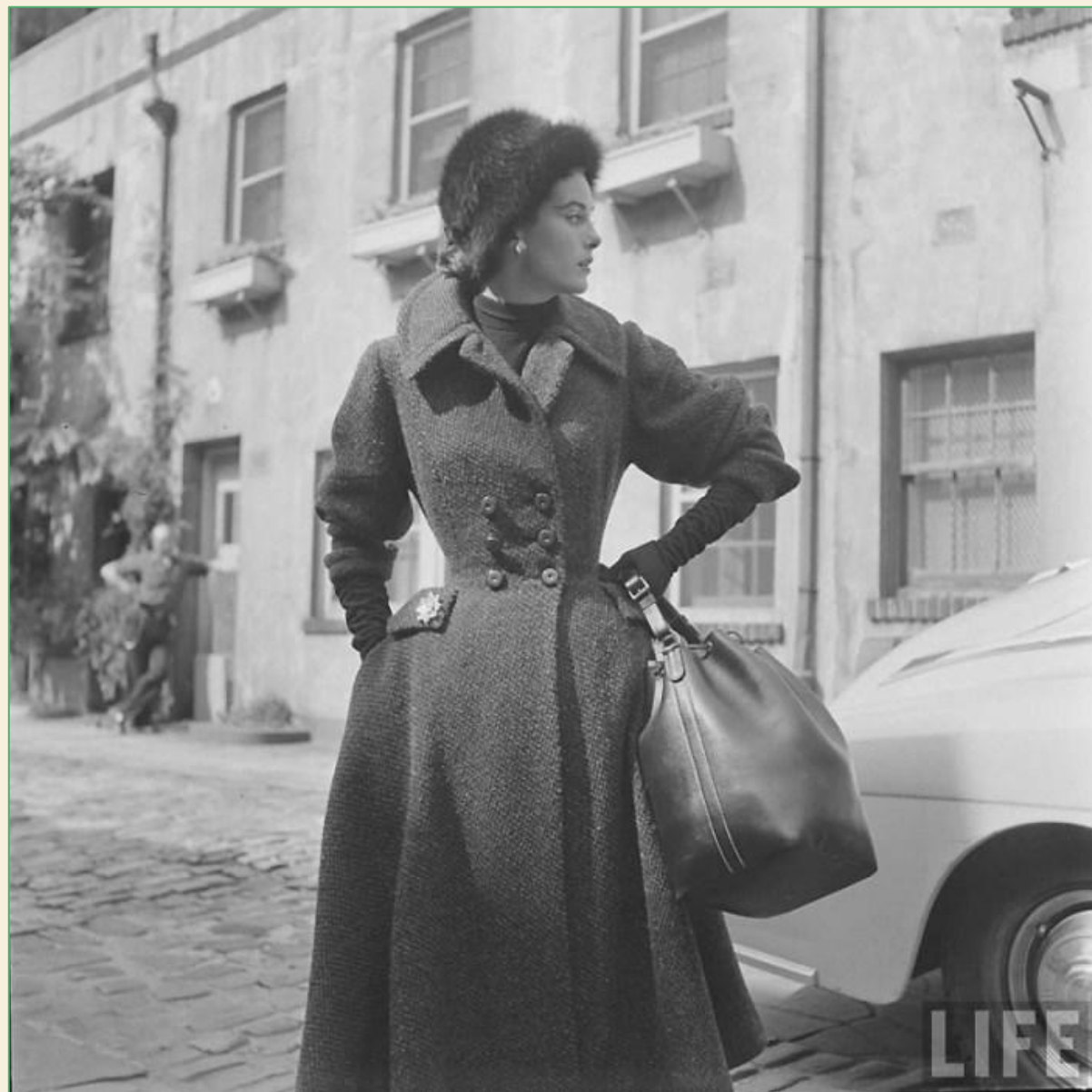
Фотография без подписи, 1940-1950