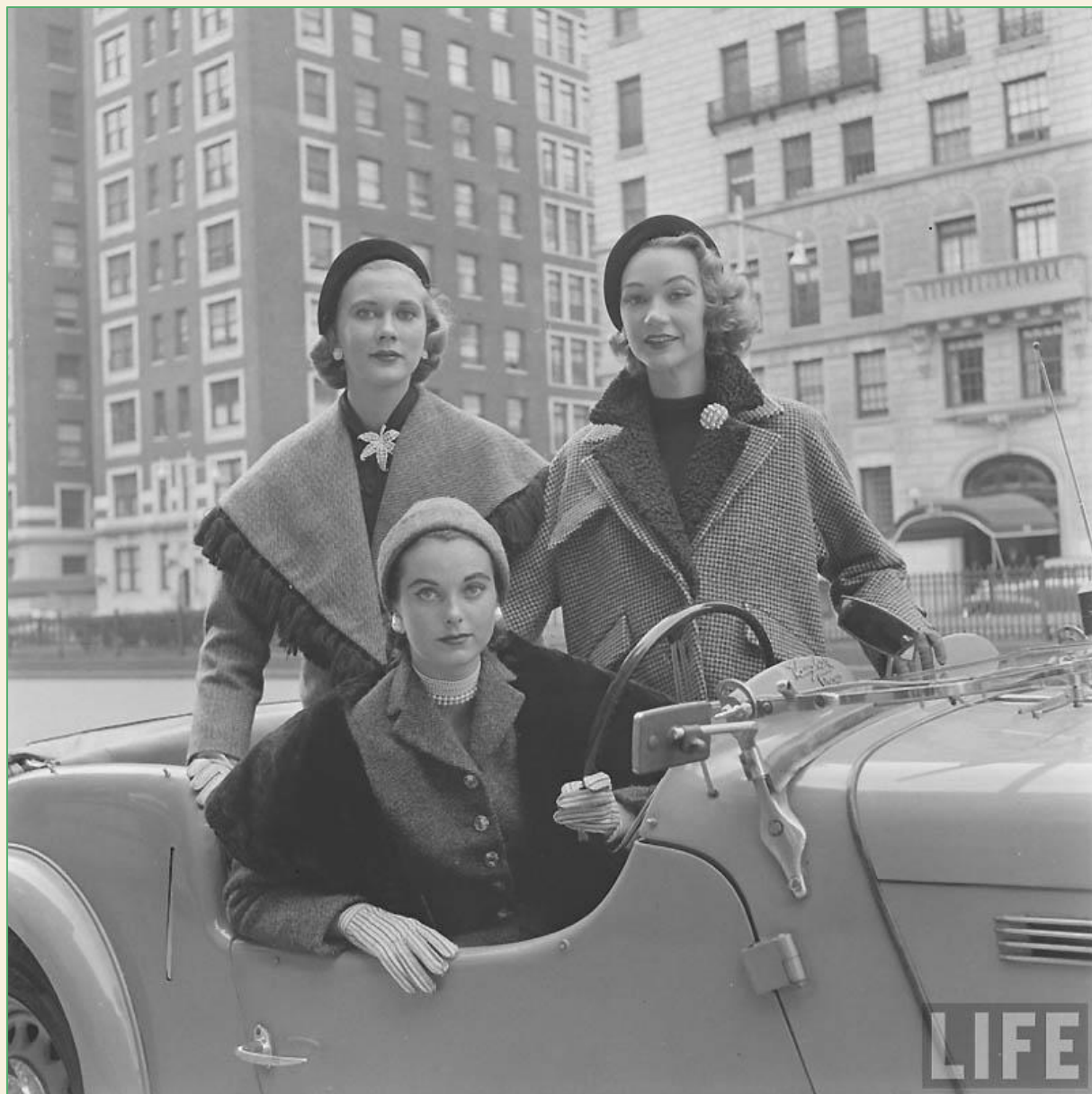
Фотография без подписи, 1940-1950