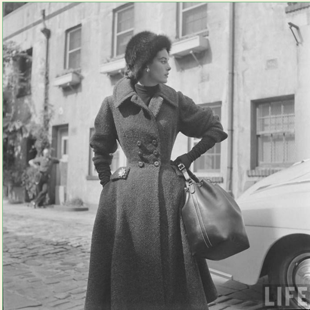
Фотография без подписи, 1940-1950