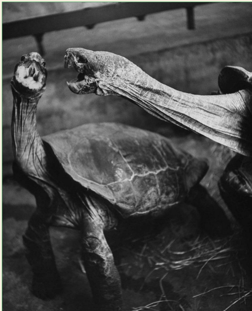
«Боевые черепахи...», 1940