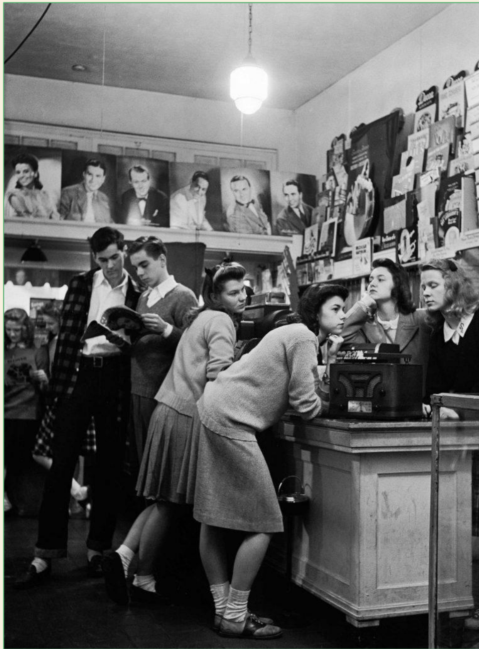
«Подростки слушают пластинки», 1944