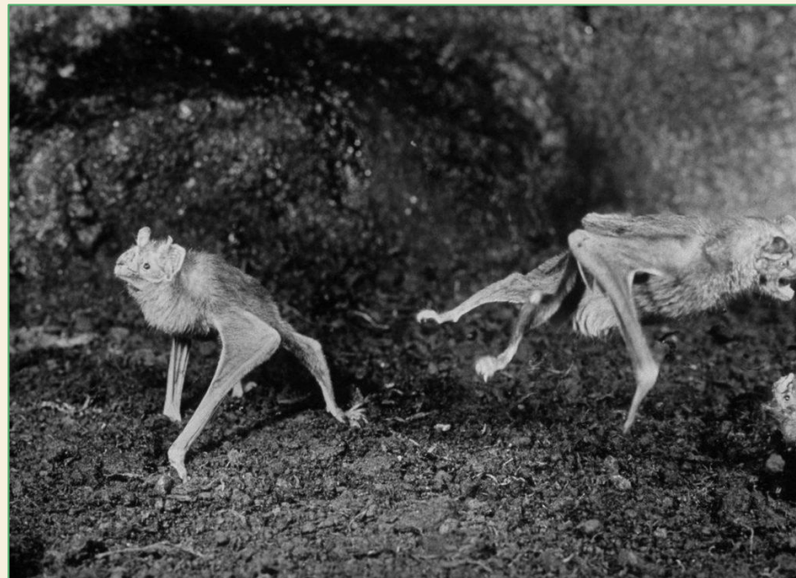
«Летучие мыши- вампиры в зоопарке Цинциннати», 1968