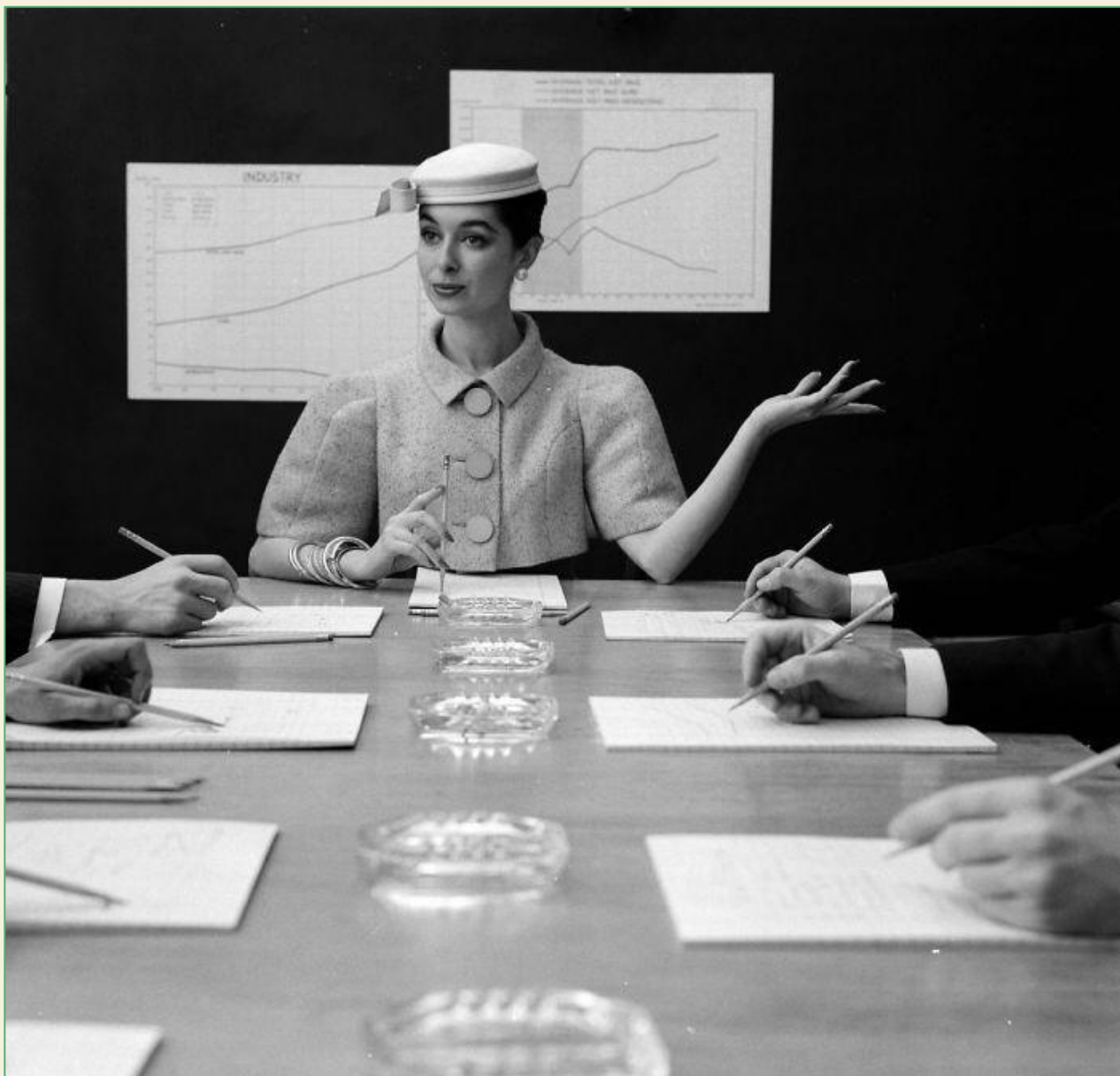
Фотография без подписи, 1940-1950