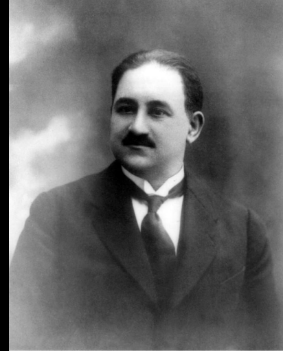
Məhəmməd Əmin Rəsulzadə