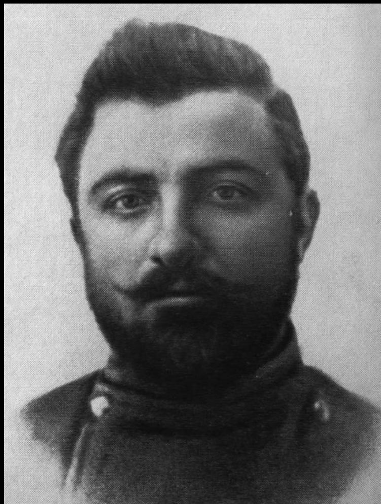
Прокопай Апрасионевич Джапаридзе