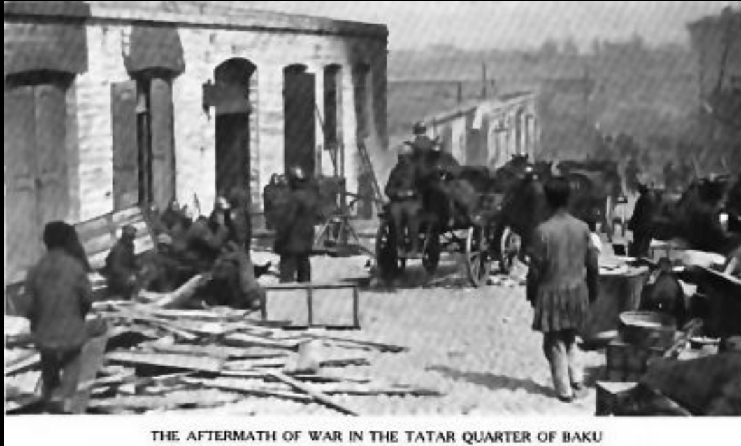
THE AFTERMATH OF WAR IN THE TATAR QUARTER OF BAKU