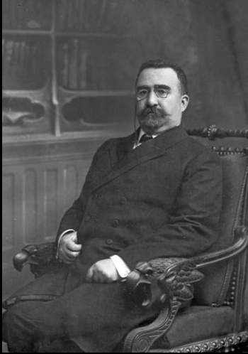
Əlimərdan bəy Topçubaşov