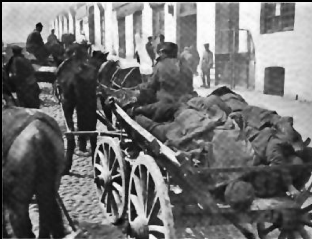
REMOVING THE DEAD FROM THE STREETS OF BAKU