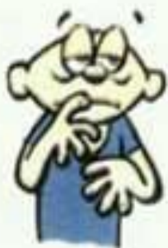
состояние патологического страха