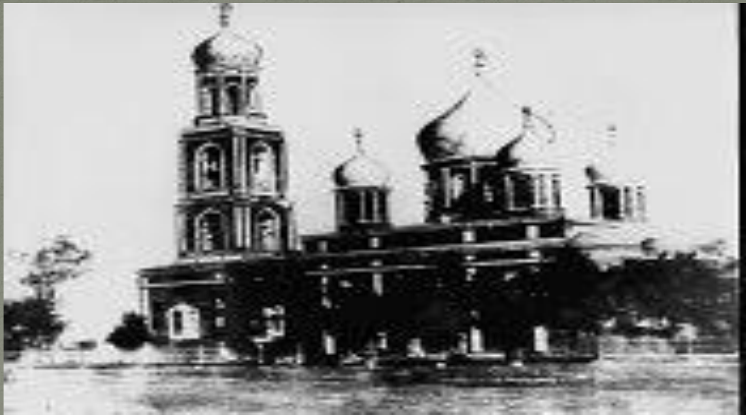
Храм Казанской Божьей Матери