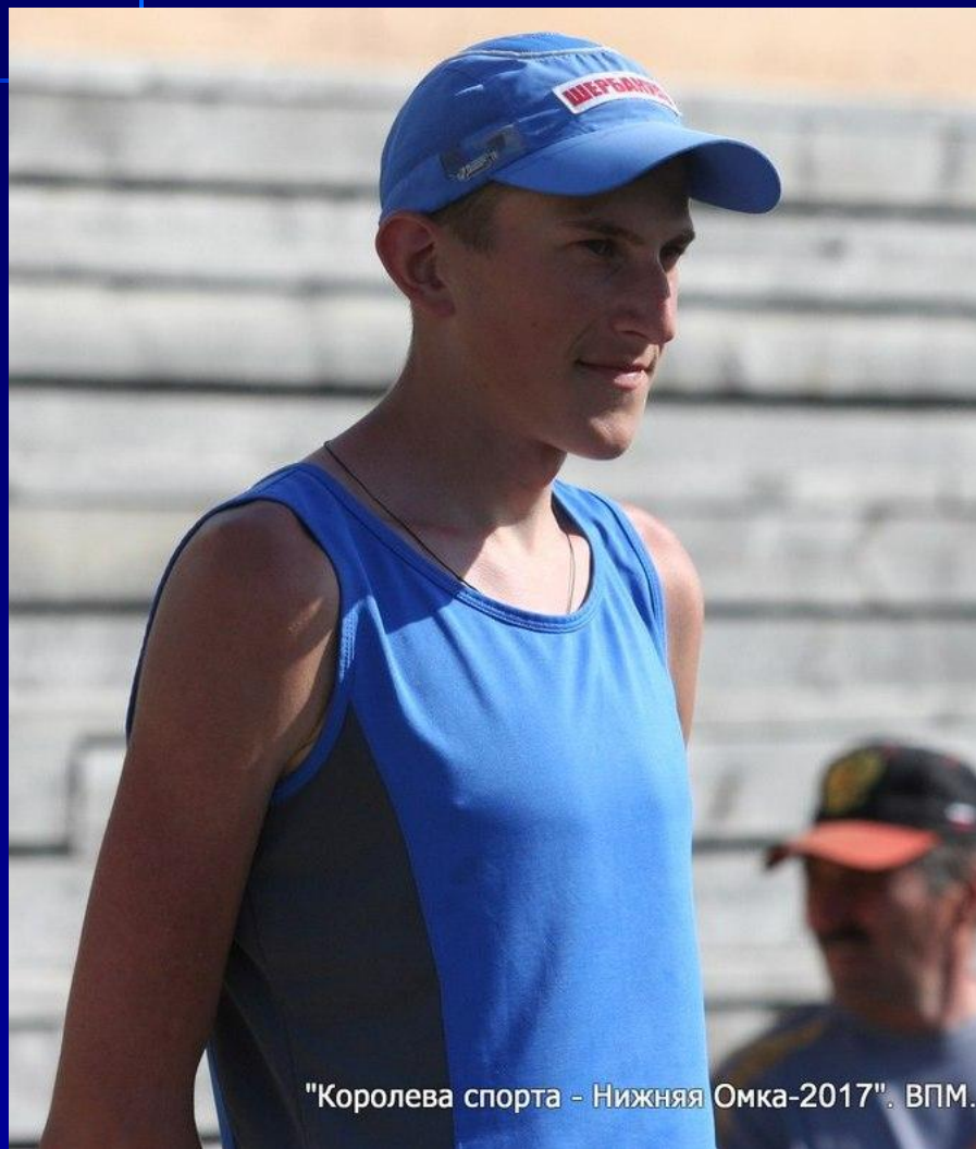
"Королева спорта - Нижняя Омка-2017". ВПМ.

3 место «Королева спорта – Нижняя Омка – 2017»