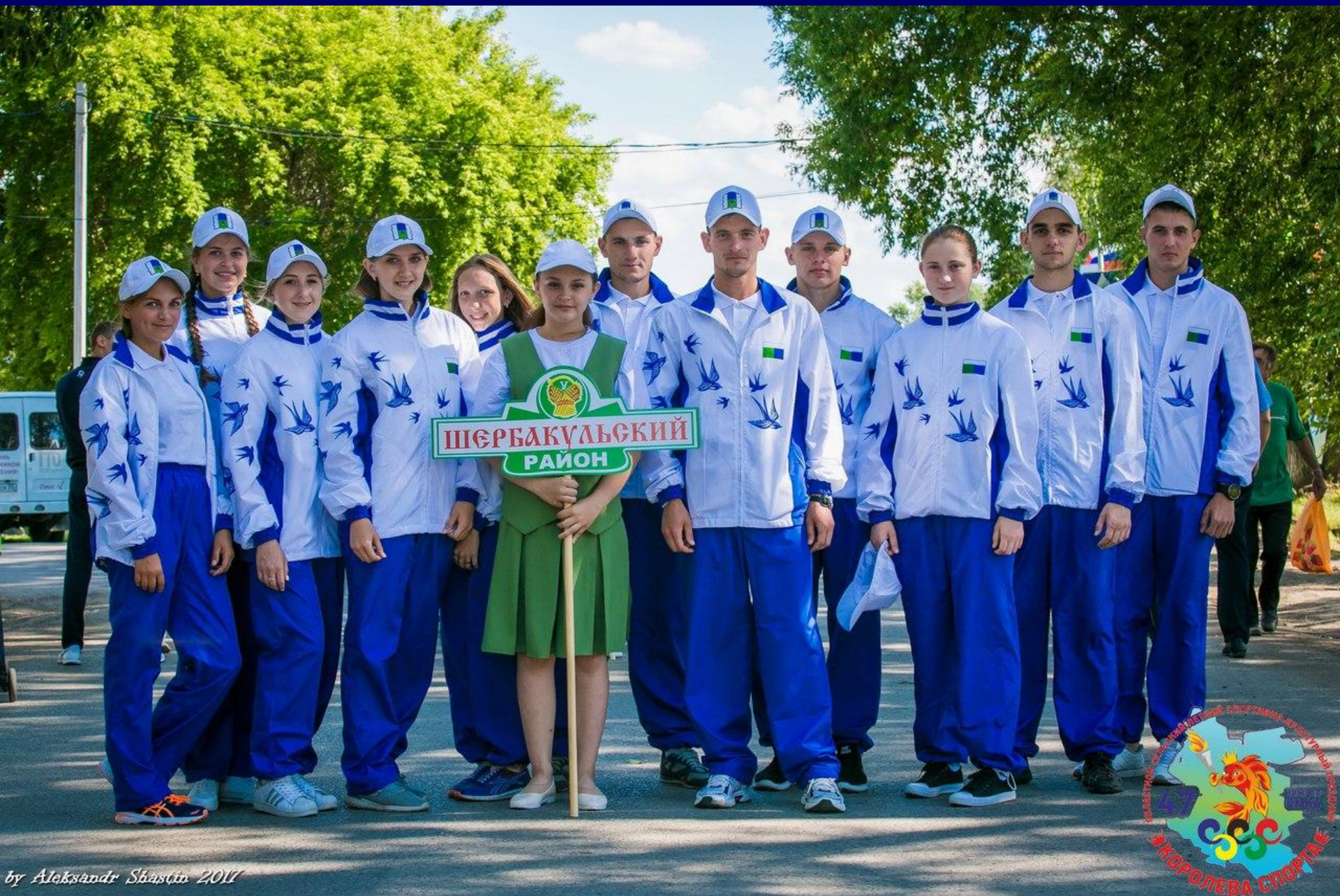
by Aleksandr Shastin 2011