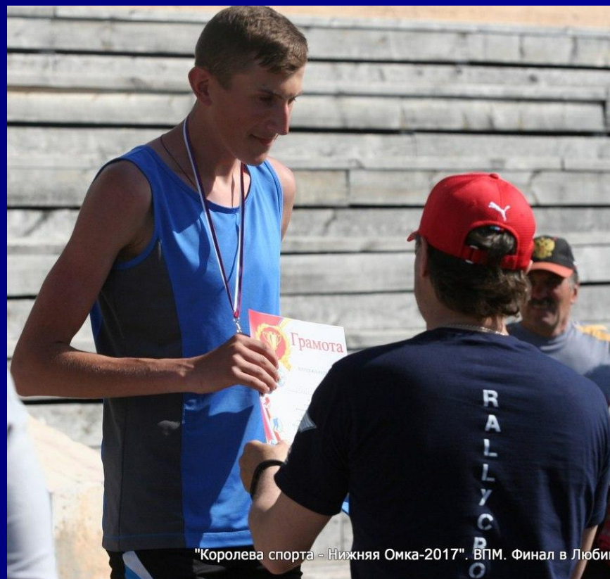
"Королева спорта - Нижняя Омка-2017". ВПМ. Финал в Любин

3 место «Королева спорта – Нижняя Омка – 2017»