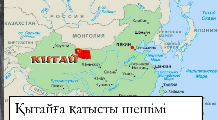
Қытайға қатысты шешімі