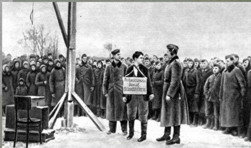
Зоя Анатольевна Космодемьянская