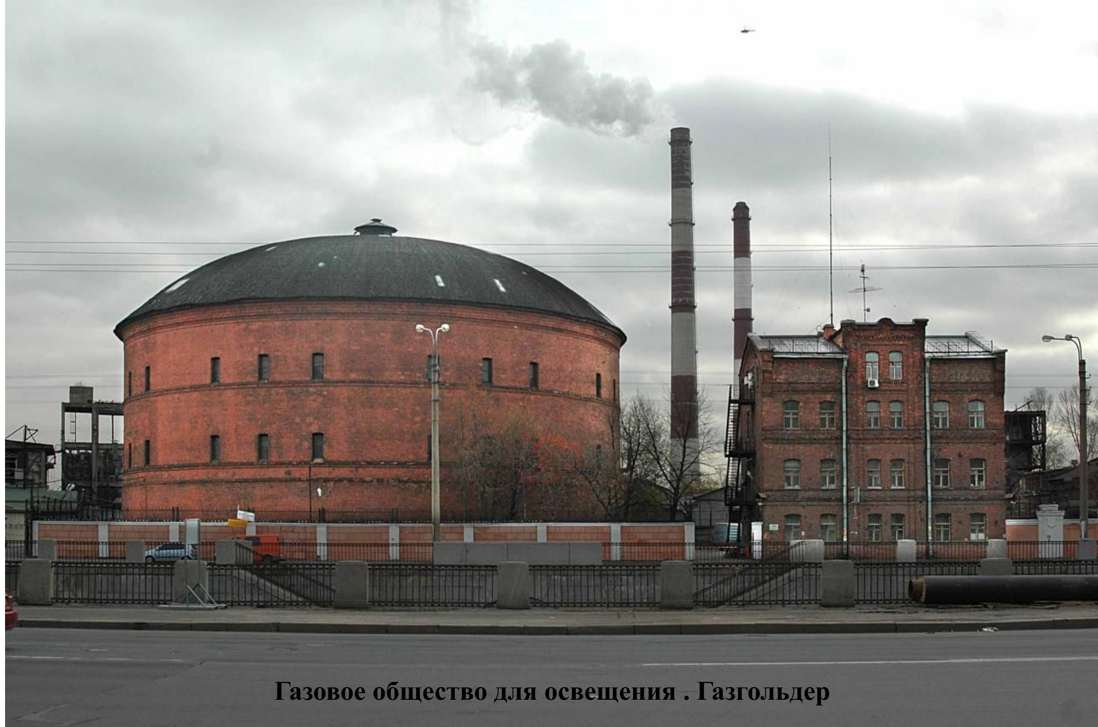
Газовое общество для освещения . Газгольдер