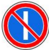
Знак 3.29. Стоянка запрещена по нечетным числам месяца