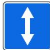
Знак 5.8. Реверсивное движение