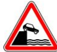
Знак 1.10. Выезд на набережную