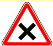
Знак 1.6. Пересечение равнозначных дорог