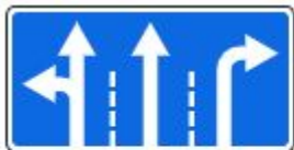
Знак 5.15.1. Направления движения по полосам