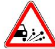
Знак 1.18. Выброс гравия