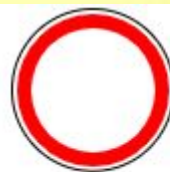
Знак 3.2. Движение запрещено