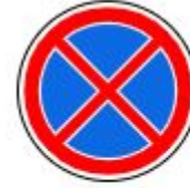
Знак 3.27. Остановка запрещена