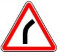
Знак 1.11.1. Опасный поворот (правый)