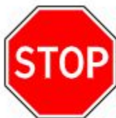
Знак 2.5. Движение без остановки запрещено