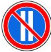
Знак 3.30. Стоянка запрещена по четным числам месяца