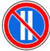
Знак 3.30. Стоянка запрещена по четным числам месяца