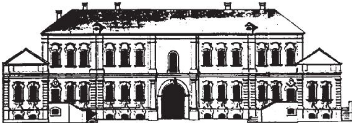
Дворец Кантемира. Вид со стороны Миллионной улицы. Чертёж из коллекции Берхгольца. 1740-е

Архитектором Луиджи Руска в 1798 году в стиле классицизма был перестроен корпус со стороны Миллионной улицы для ЛИТТОВ .