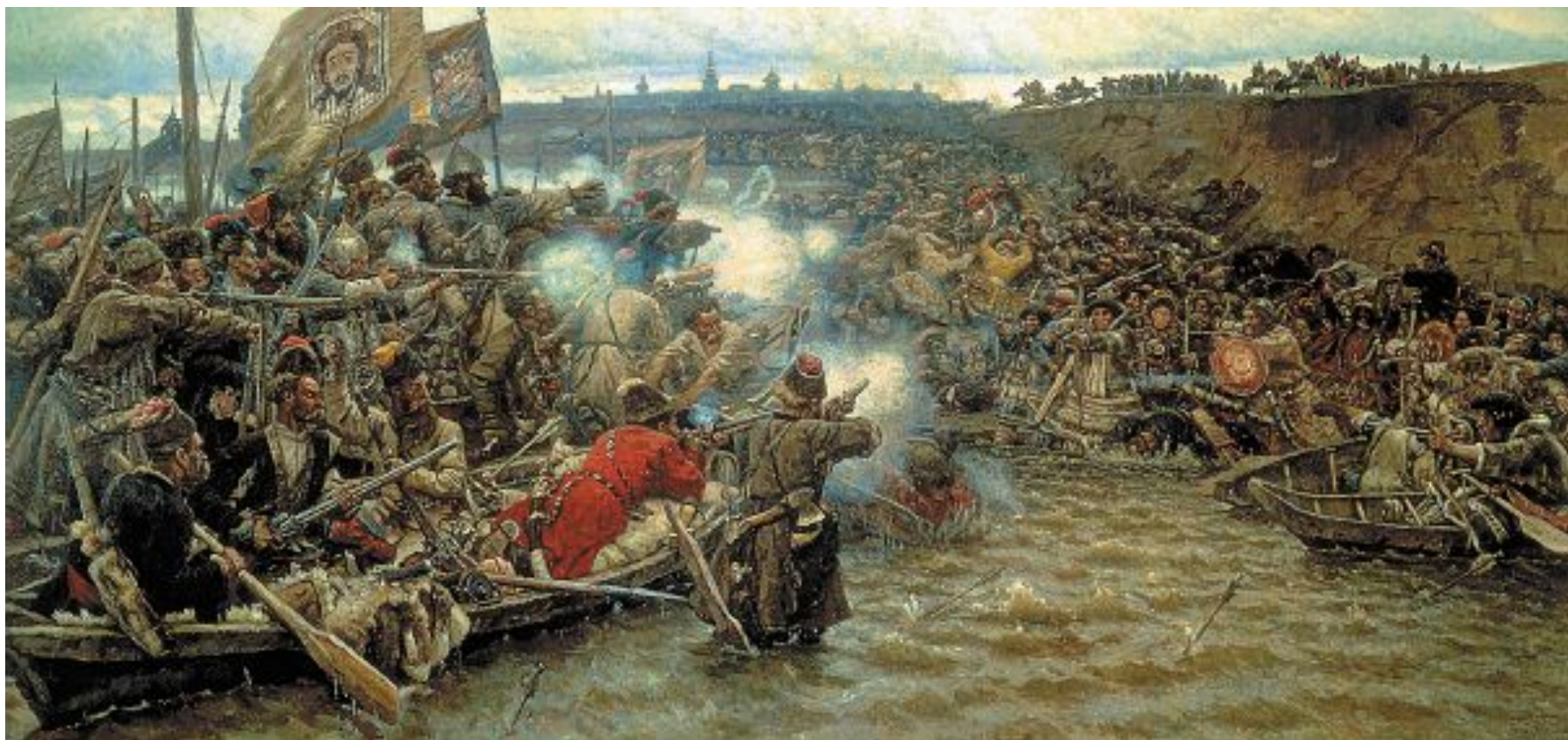
В.И. Суриков. Покорение Сибири Ермаком

Сибирский поход Ермака на территорию Сибирского ханства в 1581-1585 годах, который положил начало русскому освоению Сибири.