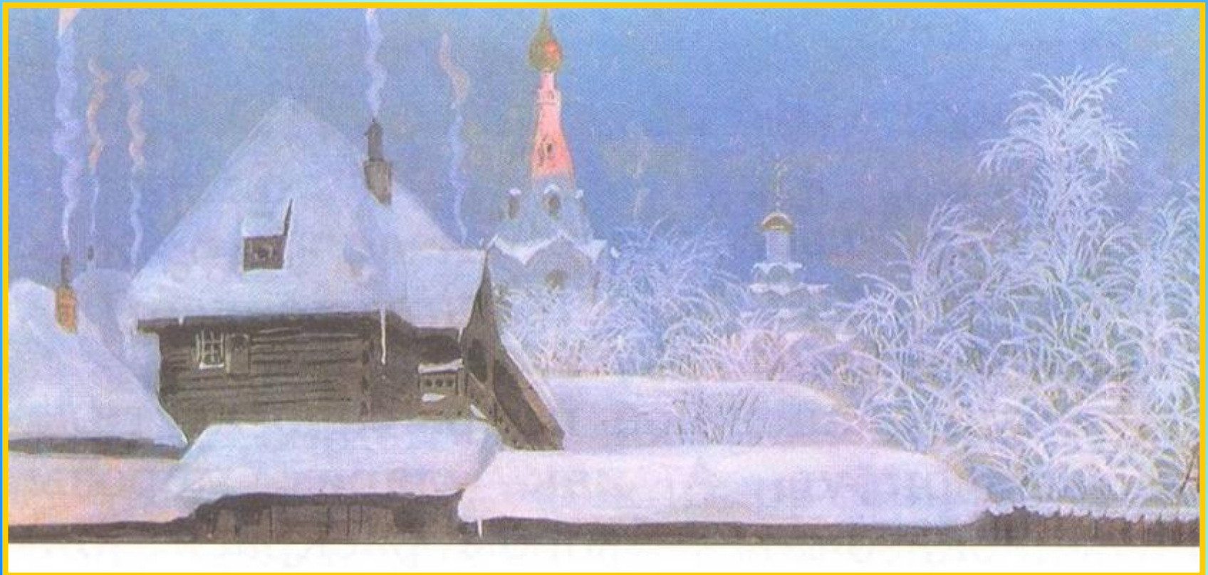
А. Рябушкин «Зимнее утро»