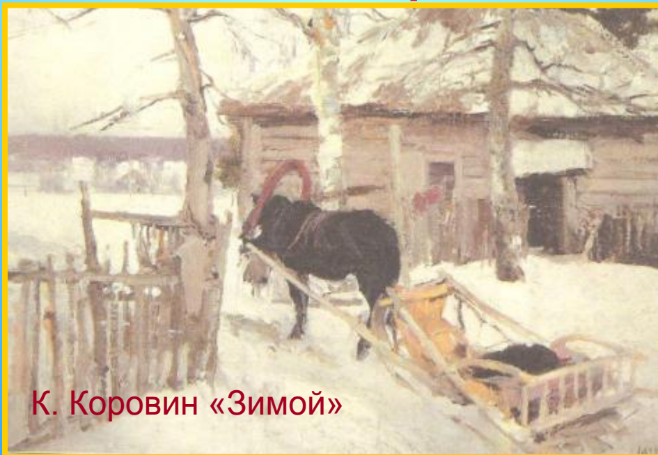
К. Коровин «Зимой»