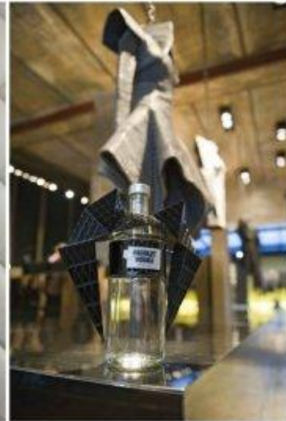
ABSOLUT MODE GARETH PUGH