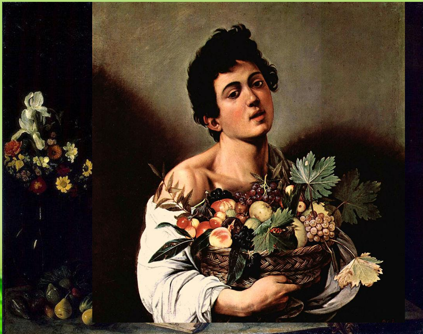
«Мальчик с корзиной фруктов»