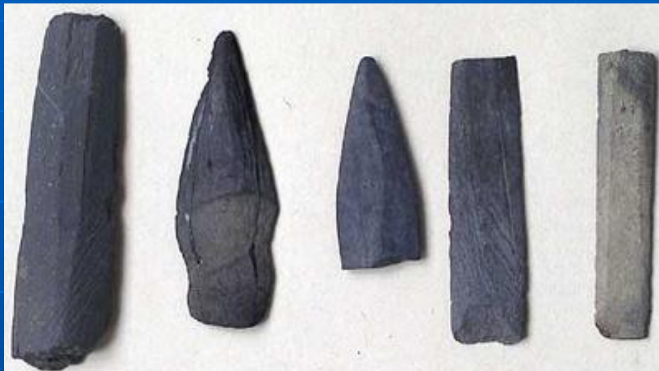
Янковские наконечники стрел