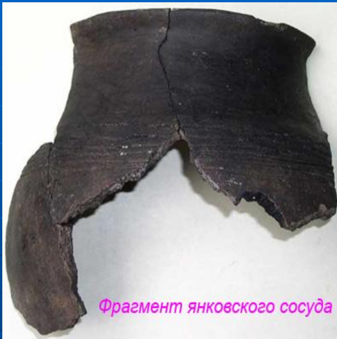
Фрагмент янковского сосуда