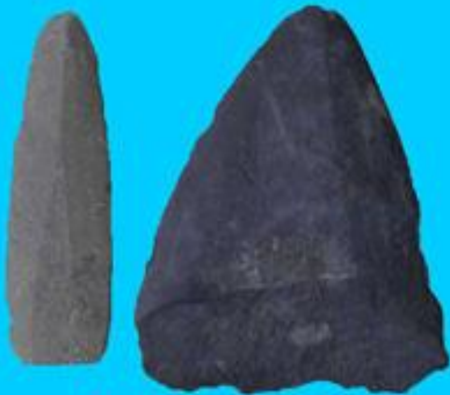
Фрагменты шлифованных каменных наконечников