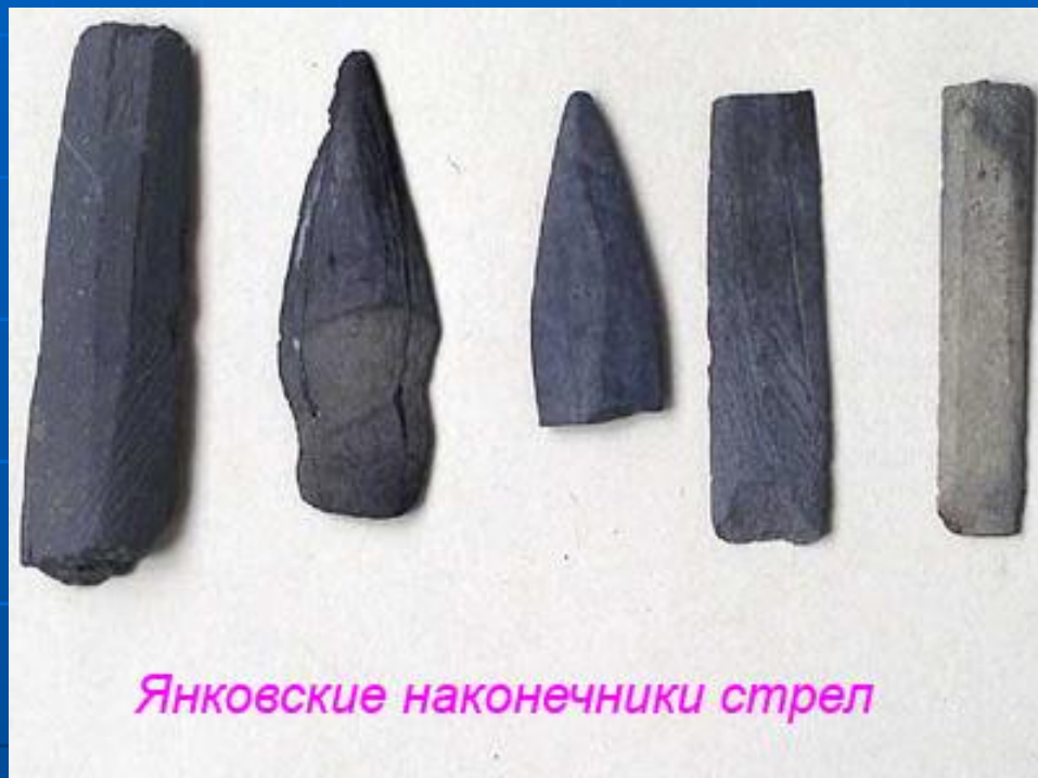
Янковские наконечники стрел