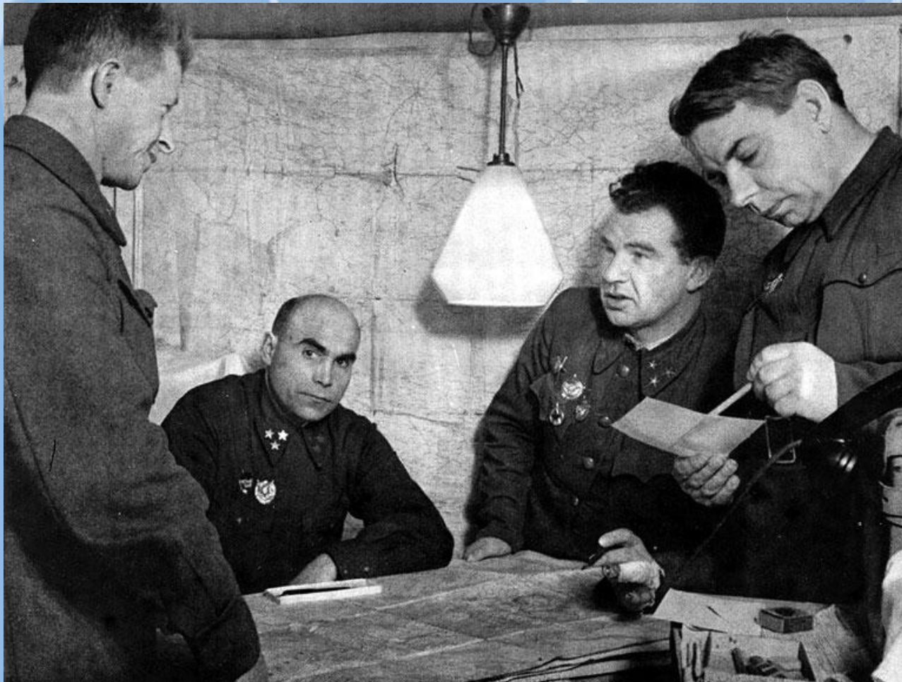
Военный Совет 62-ой армии