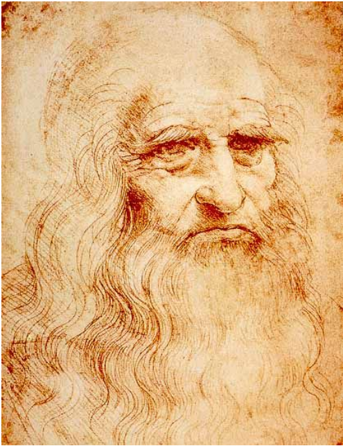
Леонардо да Винчи (1452-1519)

"Если живописец пожелает увидеть прекрасно вещи, внушающие ему любовь, то в его власти породить их, а если он пожелает увидеть уродливые вещи, которые устрашают, или шутовские и смешные, или поистине жалкие, то и над ними он властелин и Бог... И действительно, все, что существует во Вселенной как сущность, как явление или как воображаемое, он имеет сначала в душе, а затем в руках..."