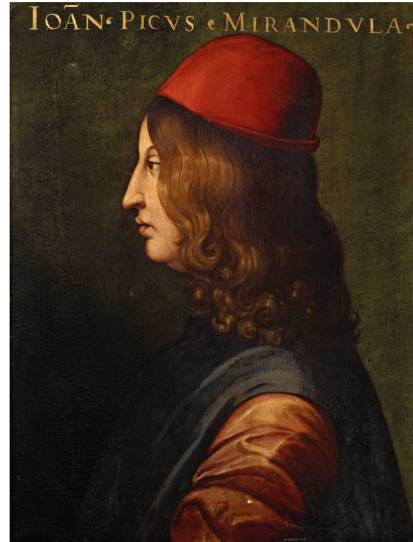
Пико делла Мирандола