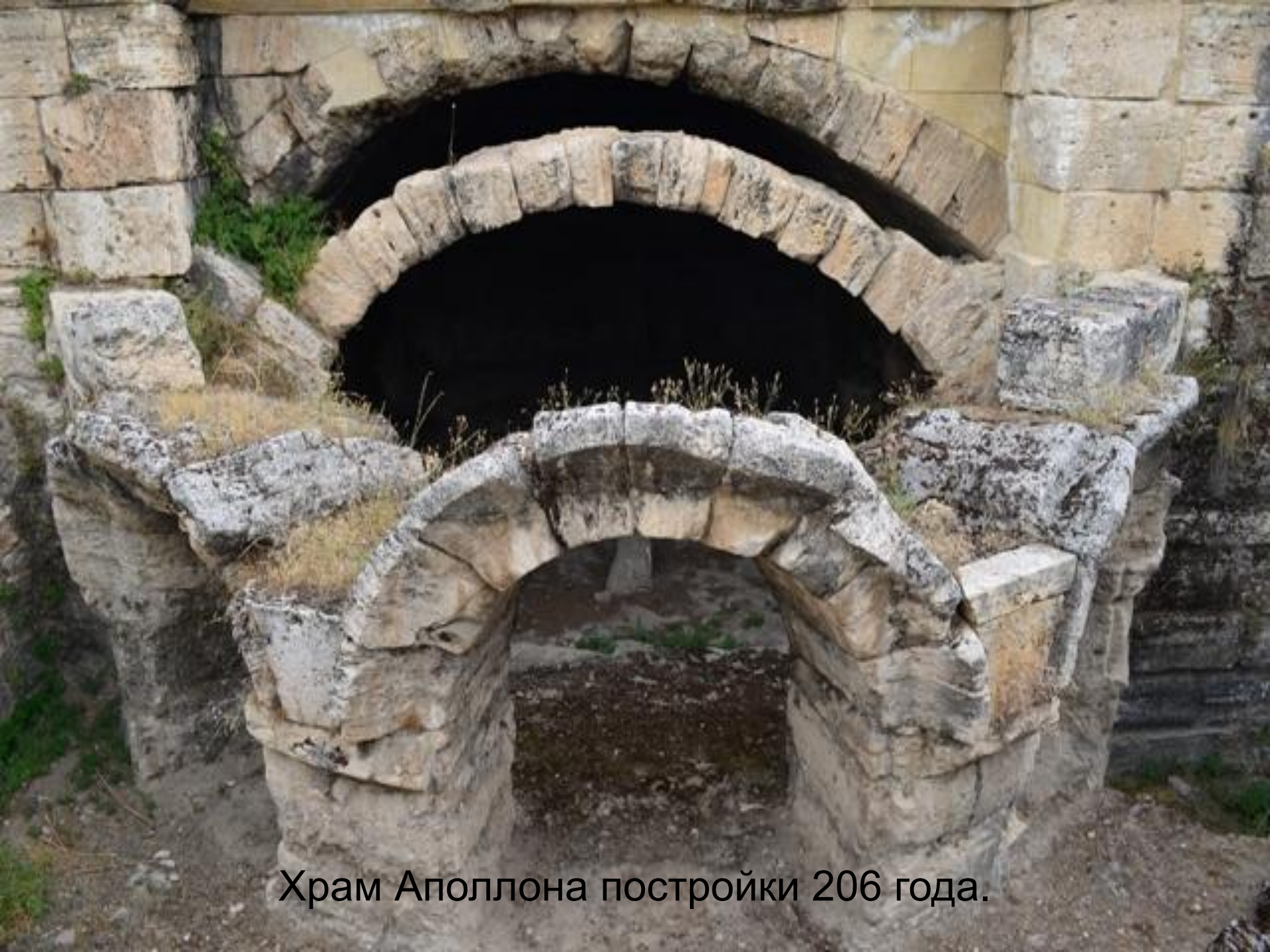
Храм Аполлона постройки 206 года.