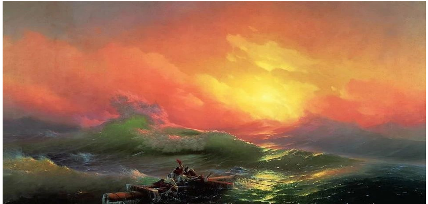
«Девятый вал» 1850 г.

Популярнейшей картиной мариниста является «Девятый вал». В нём сильнее всего передана романтическая натура художника. Бушующий океан, группа моряков, жаждущих спасения на обломках мачт... И первые утренние лучи солнца, дарящие надежду на лучшее.