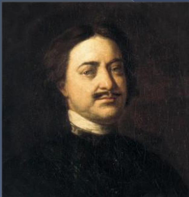
И. Никитин "Портрет Петра I"

«Сделать академию, а ныне приискать из русских, кто учен и к тому склонность имеет, также начать переводить книги юриспруденции»