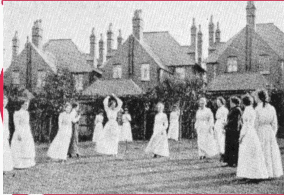
Английские женщины играют в нетбол в 1910г.