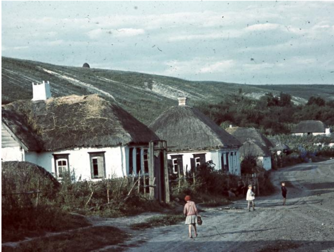
Сама община (само сообщество)