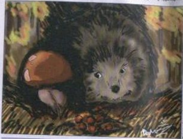
Рисунок: Ирина Козлова

Девочка смотрела на картинку и рассказывала. Было это в начале первого класса... Сейчас эта девочка уже в третьем классе... Угадай, кто автор этого рассказа и пришли ответ на адрес редакции вместе со своим рассказом. Лучшие из них мы обязательно опубликуем!