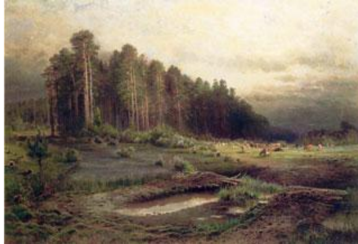
А. Саврасов «Лосиный остров»