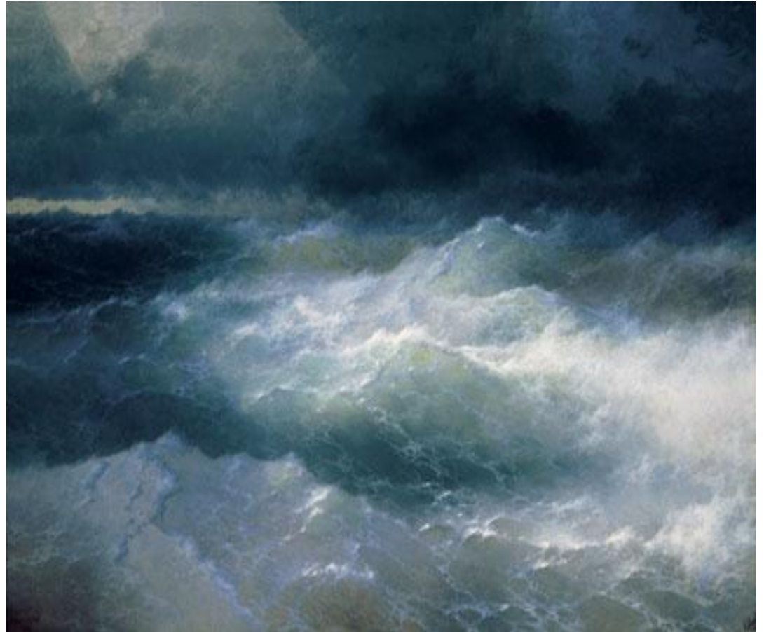
И.Айвазовский «Черное море»