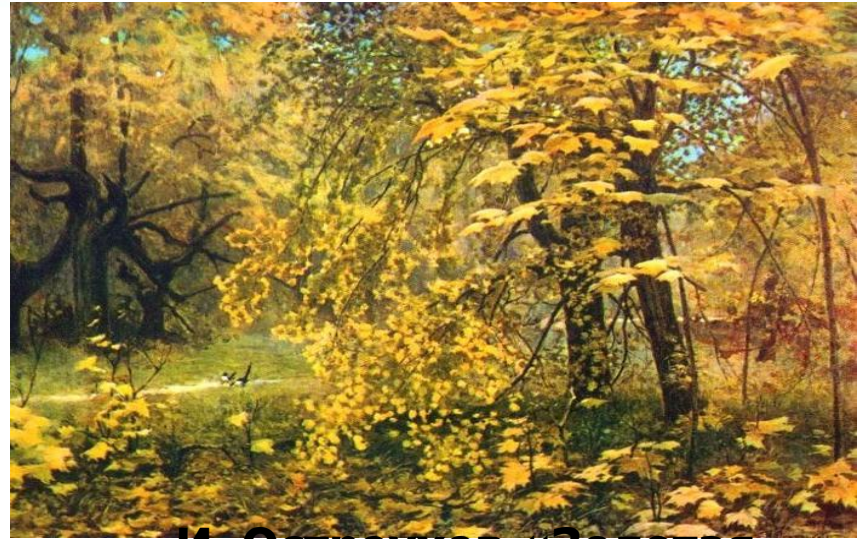
И. Остроухов «Золотая осень»