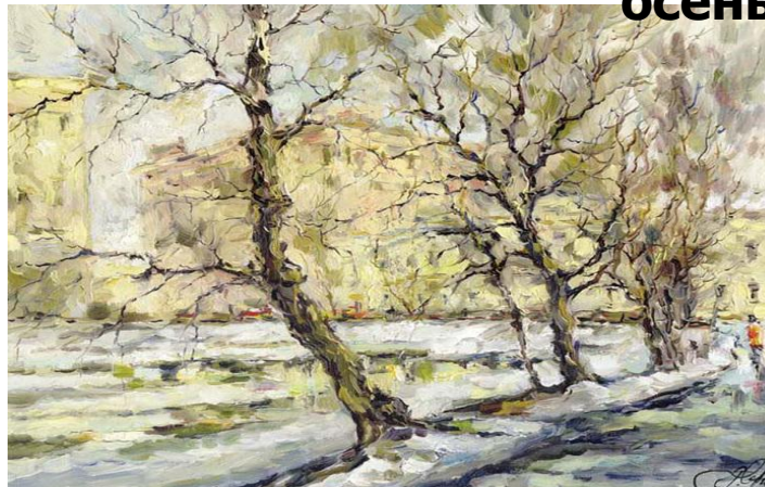
Ф. Васильев «Оттепель»