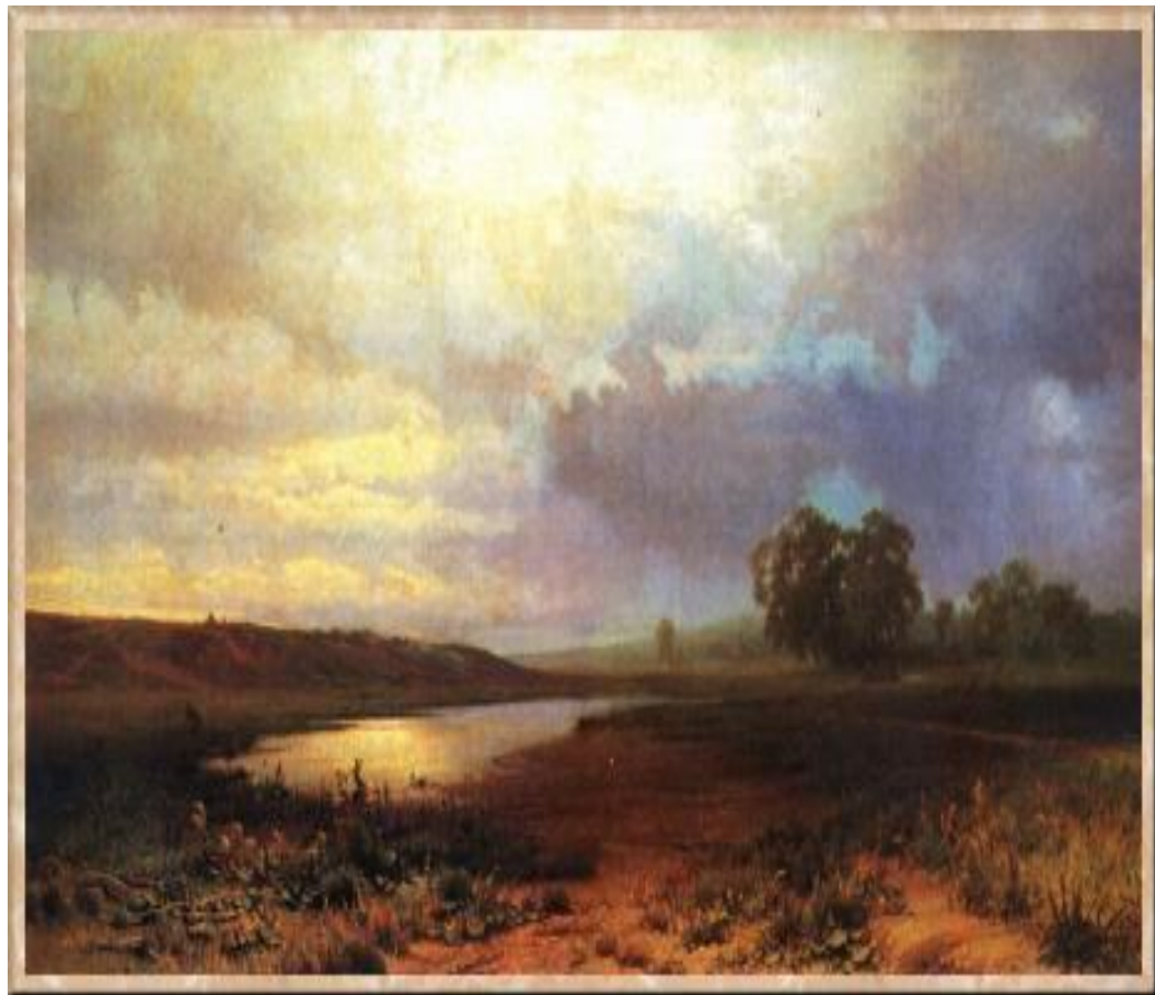
В. Поленов «Речка Свинка»