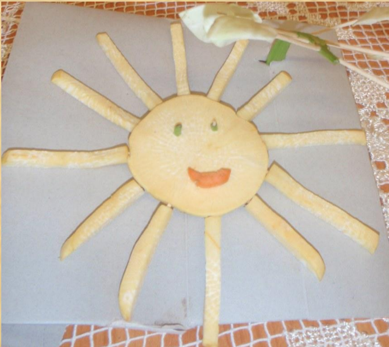
«Солнышко - колоколнышко» Витя и Женя Карцевы 2 класс