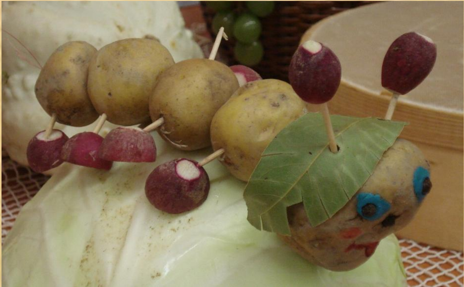
Носовы Саша и Влада 2 класс «Веселая сороконожка»