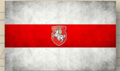
Флаги Республики Беларусь

Звук [э] в русском языке, очень редко обозначается буквой “Э”. Чаще он обозначается буквой “Е”, которую мы изучим позже. А в белорусском языке (языке, на котором говорят в Республике Беларусь) этот звук, наоборот, всегда обозначается буквой “Э”, например: брэст, грэшнік, яшчэ.