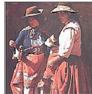
Мачу-Пикчу – древний город инков.

Эрнандес Кортес в 1521 г. с невероятной жестокостью разрушил государство ацтеков. Франциско Писсаро с такой же жестокостью уничтожил государство инков. В 1532 г. он обманым путем захватил Верховного Инку Атаульпу, который в обмен на свою свободу предложил неслыханный выкуп: заполнить золотом комнату, в которой он был в заключении. Верховный Инка сдержал свое слово, но испанцы, получив золото, казнили его. До прибытия Колумба численность коренного населения составляла 20 млн. чел., а в 1521 г. – 7,3 млн. чел.