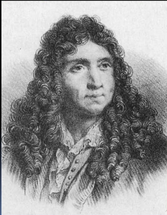
Пьер Бошан (1637-1705) Первый французский хореограф

Танец стал превращаться в балет, когда его начали исполнять по определенным правилам. Впервые их сформулировал французский балетмейстер Пьер Бошан (1637–1705), живший и творивший во времена короля Людовика XIV. Тогда спектакли придворного балета достигли особого великолепия.