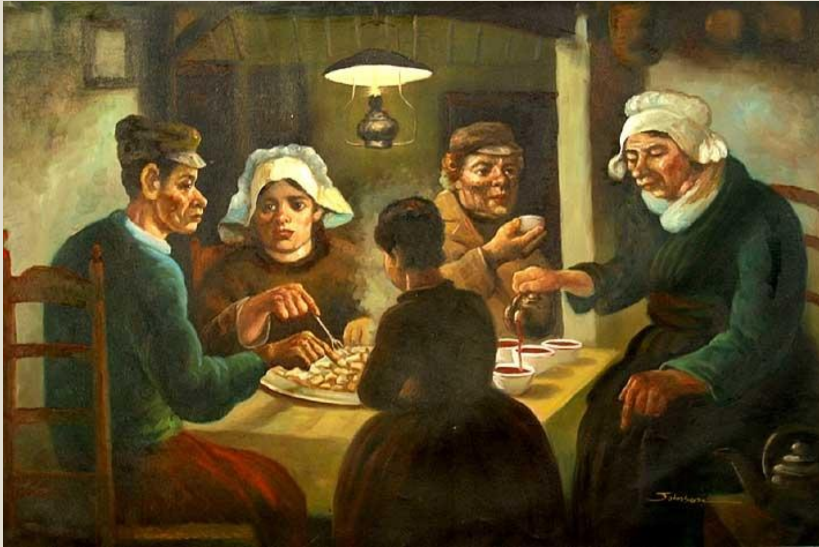
◦ В. Ван Гог «Едоки картофеля»