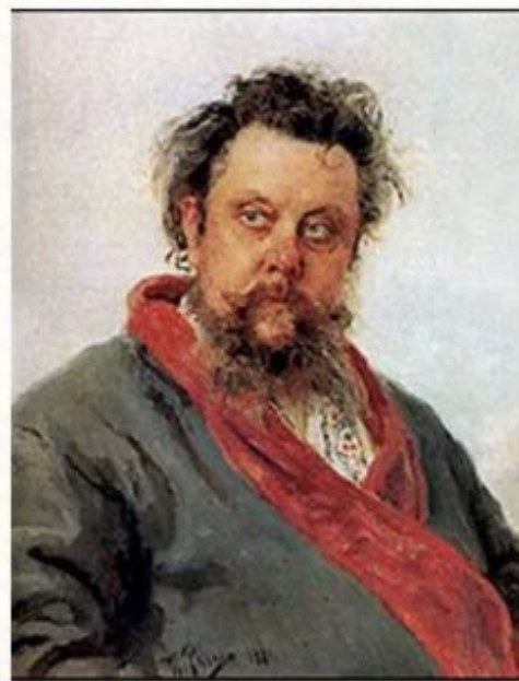
"Портрет композитора М.П. Мусоргского". 1881 г.