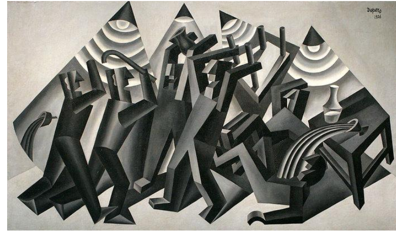
Фортунато Деперо. "Драка"