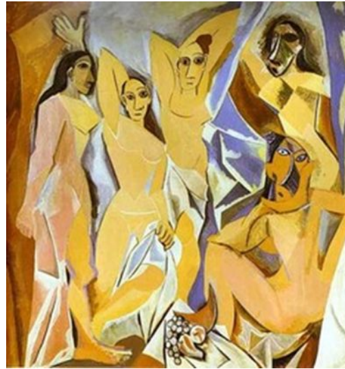
Пабло Пикассо "Авиньонские девушки"