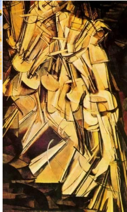
Дюшан Марсель Обнаженная, спускающаяся по лестнице