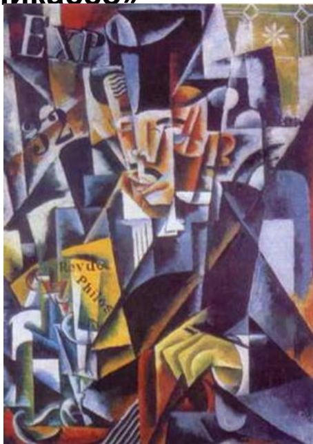
Попова Л. С. «Портрет философа»