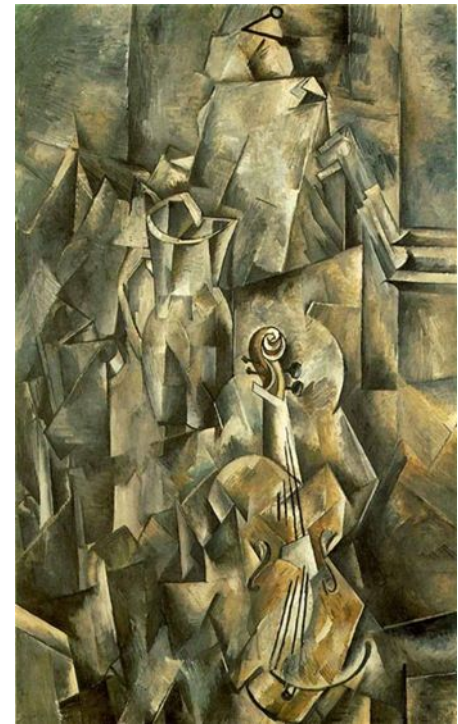
Жорж Брак "Скрипка и Кувшин" 1910 г.