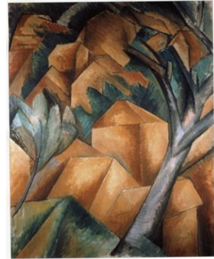
Жорж Брак. "Дома в Эстаке".