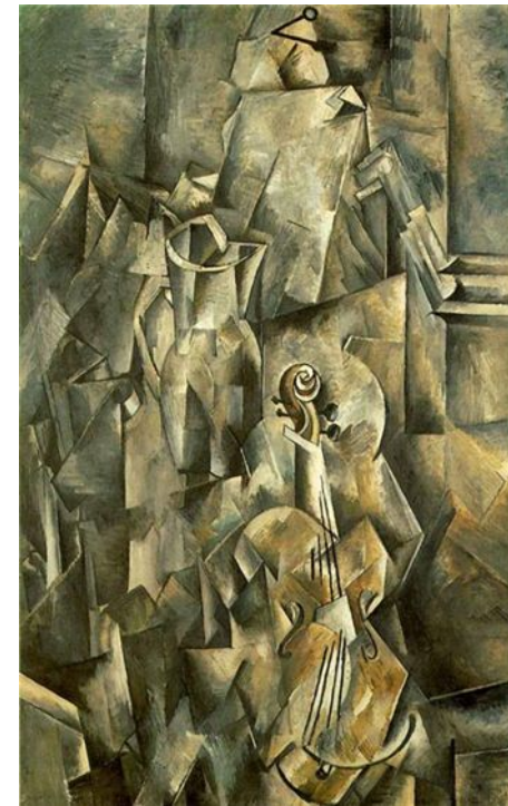
Жорж Брак "Скрипка и Кувшин" 1910 г.