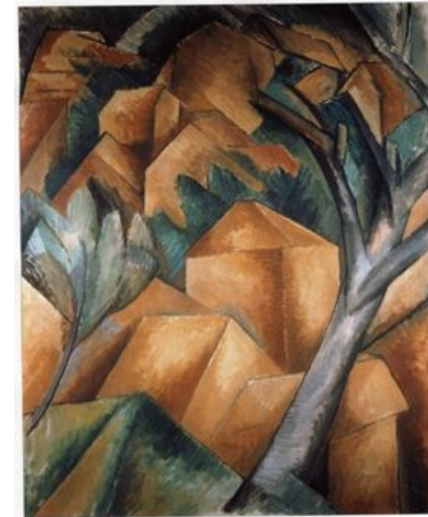
Жорж Брак. "Дома в Эстаке".