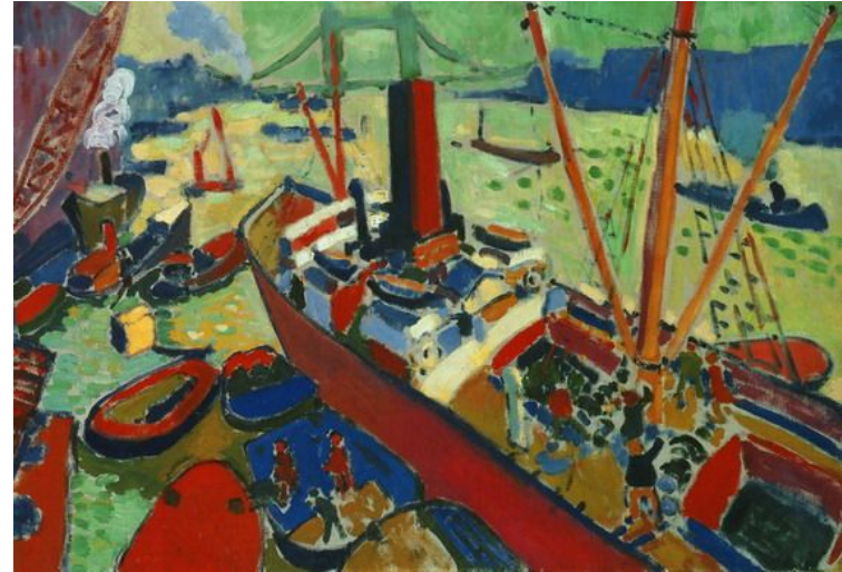
Андре Дерен. Темза у Лондонского моста.