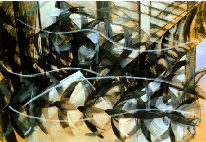
Полет ласточек. Балла Джакомо