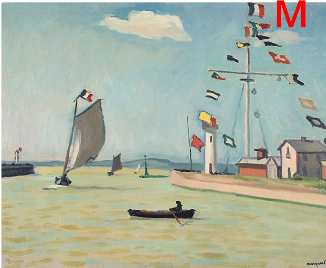
Марке Альбер «Порт в Онфлере»