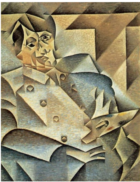
Хуан Грис. «Портрет Пикассо»