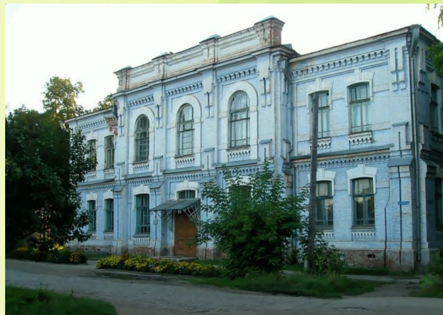
Фото группы/названия группы

Группа: средняя «Непоседы» Возрастной состав: от 4 до 5 лет 23 человека Мальчиков-13 Девочек – 10 Направленность: общеразвивающая